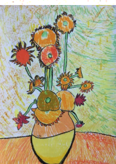
▲三忠 張佑得 ▼五忠 許筑煊