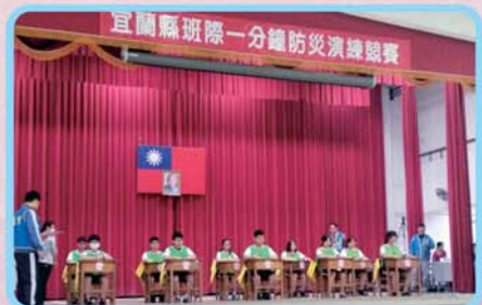
靜候警報鈴聲，本校選手蓄勢待發。