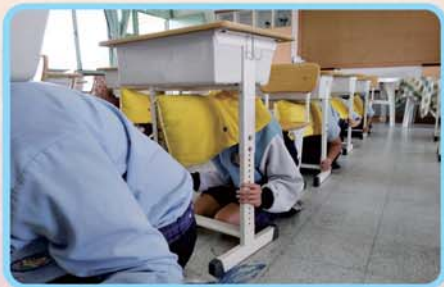
迅速確實的掩蔽動作「趴下、掩護、穩住」