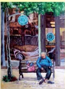
《落沒》 西畫 905黃睿霖

偶然在淡水某一間咖啡館前，看見一位老人心事重重的坐在門口的長椅上，兩眼無神呆坐著望著前方。這景象不禁使我有感觸。