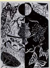
《一線之隔》 版畫 902黃雯麟

人生中往往會有許多光明面和黑暗面，人通常會習慣性的選擇光明的那一邊，但你有沒有想過，如果沒有黑暗面如何襯托出光明面的美好呢！善與惡只有一線之隔，但不一定所有的光亮都是善良的，不一定所有的黑暗都是邪惡的。善與惡要懂得取捨。