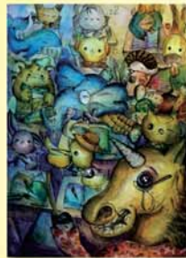
《教室奇想》 漫畫 702陳季晴

現在老年人口逐漸上升，而年輕人因為工作等等原因不在父母親身旁，因此現在老年人感到孤獨無助，所以題目才選了《落沒》。在未來的社會環境，希望能多多重現老年人的生活，使他們能活得更加充實、更加快樂。