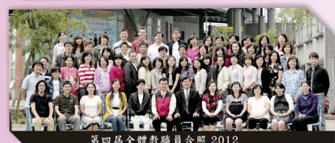
第四屆全體教職員合照 2012