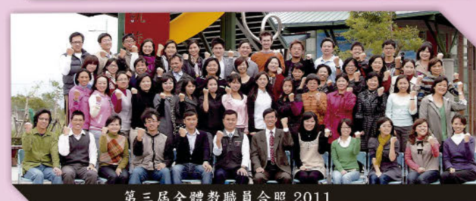
第三屆全體教職員合照 2011