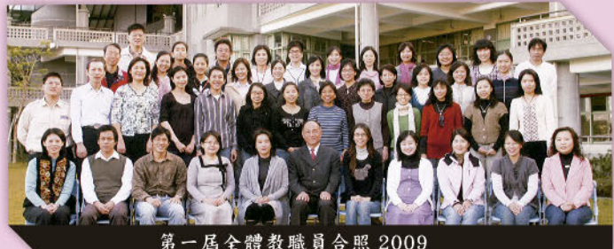
第一屆全體教職員合照 2009