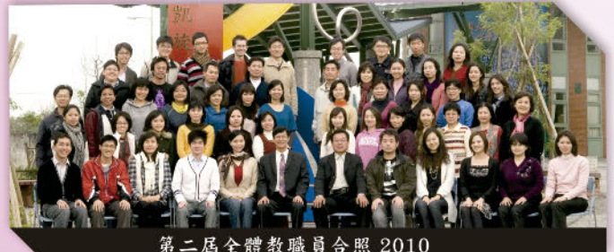
第二屆全體教職員合照 2010