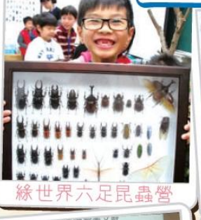
綠世界六足昆蟲營