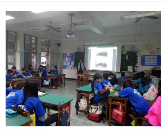
教師利用 PPT 及校史教材講述社區歷史。