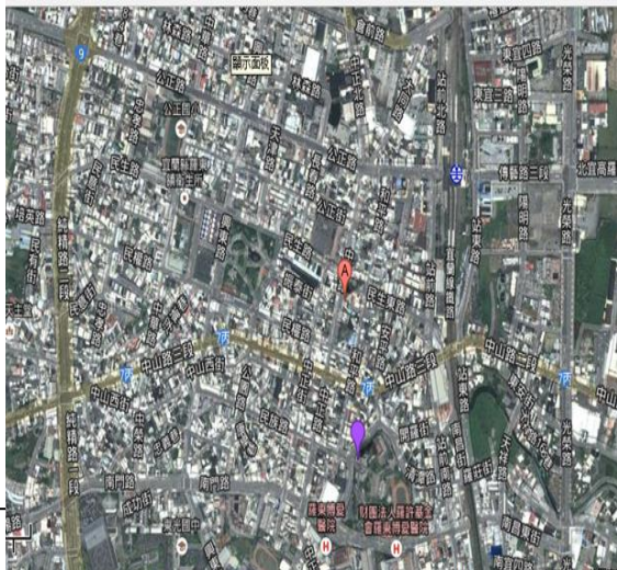
透過 google 街道地圖，認識學校周邊社區整體的地理環境