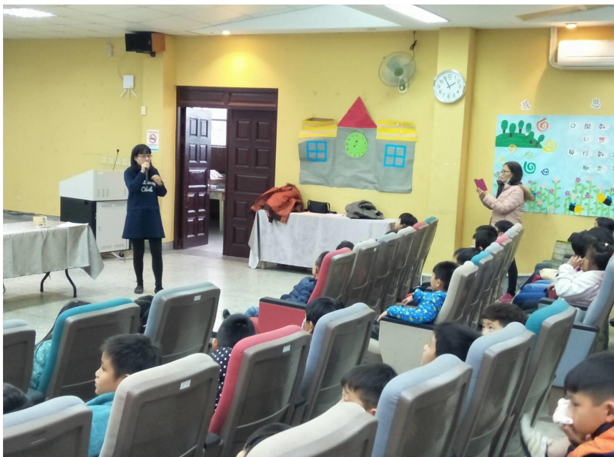
護士孟慈阿姨分享工作的內容