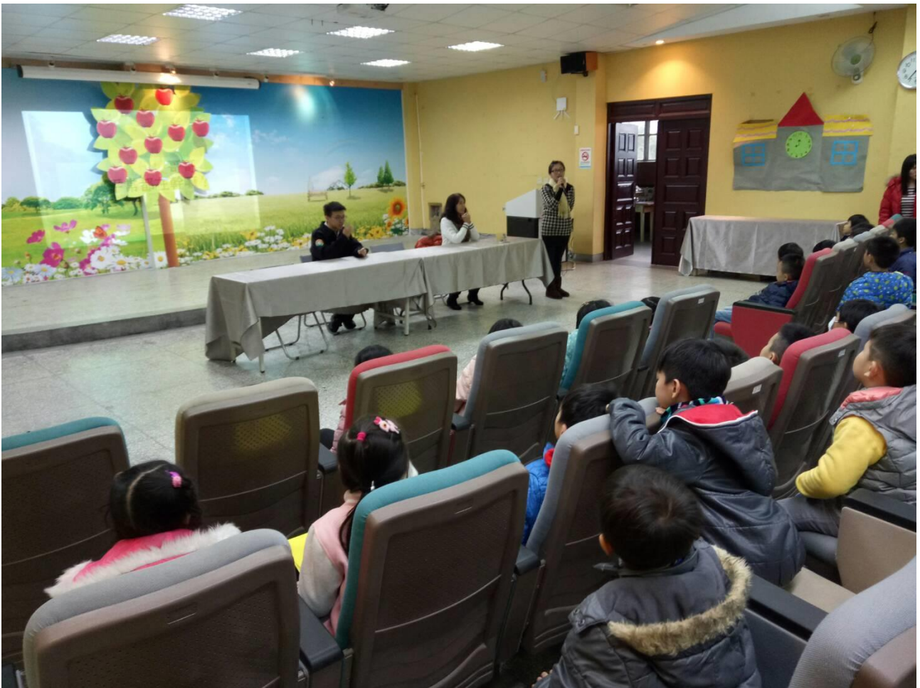
工友魏阿姨的分享