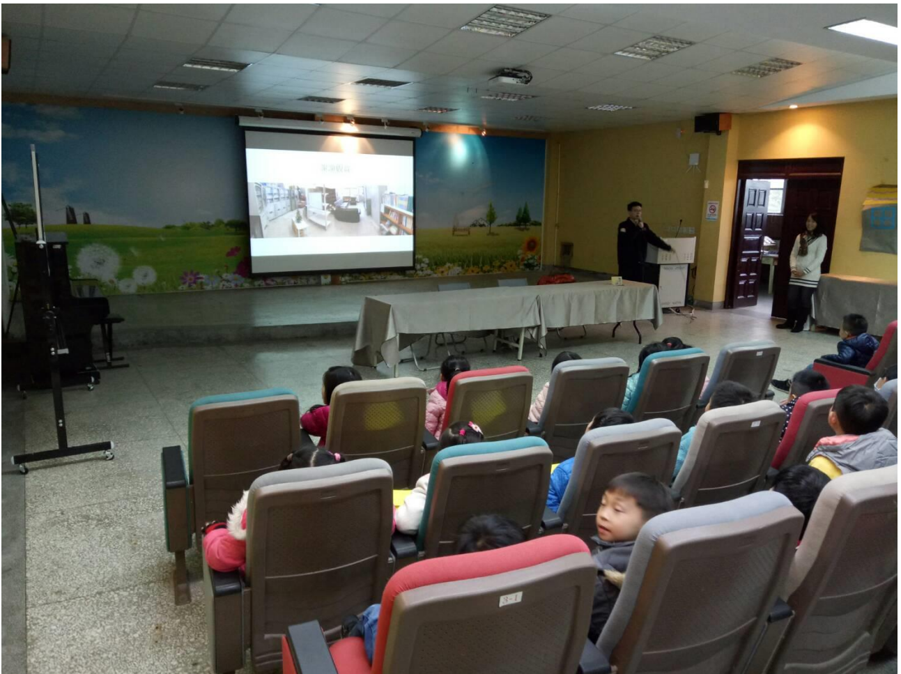
替代役栢元哥哥的分享