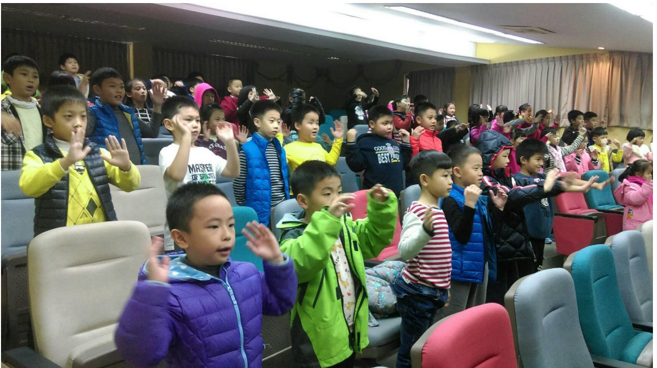
小朋友一起合唱感恩的心