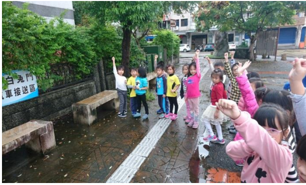
我們都是經由白兔門上學和回家的小朋友