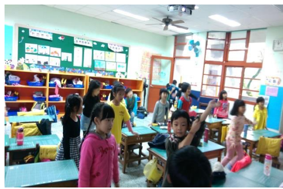
看小朋友可愛的模樣