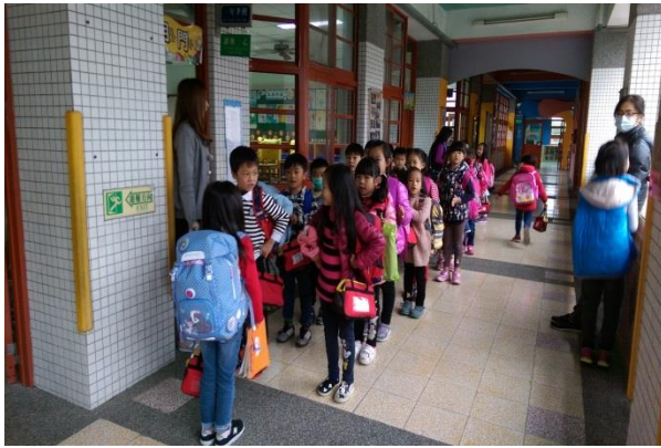
放學時要聽從導師的提醒，排好路隊準備回家