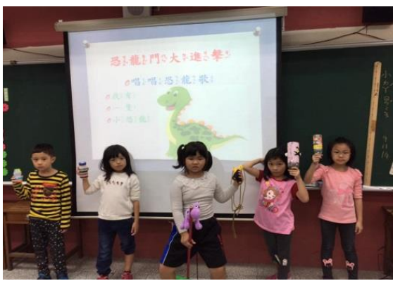
拿著自己製作的樂器唱唱恐龍歌