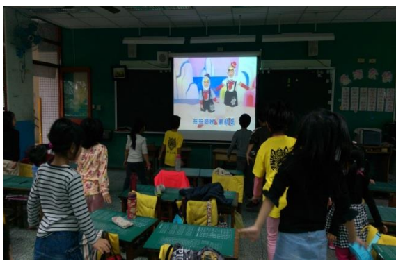
小朋友看著影片學跳企鵝歌