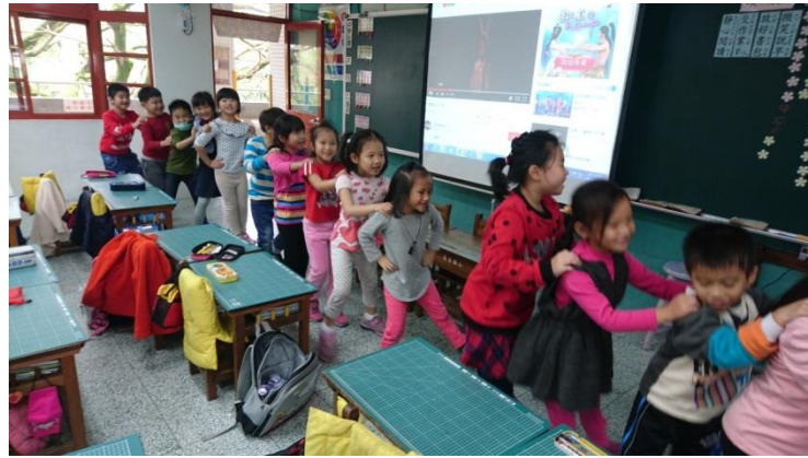
一起來跳兔子舞 左、左、右、右、前跳、後跳、跳跳跳