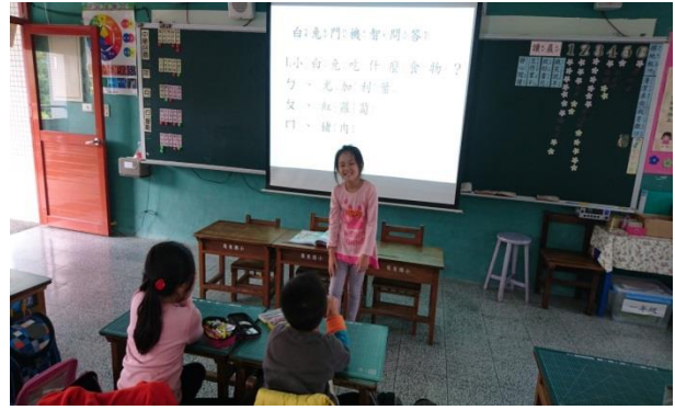
白兔門機智問答 大家一起來搶答