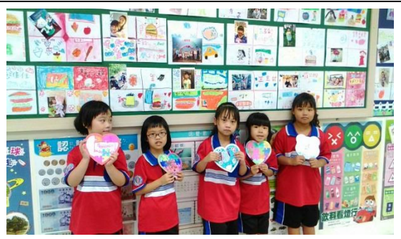
欣賞大家的校門拼圖設計