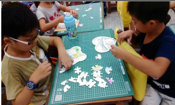
完成我們的校門拼圖