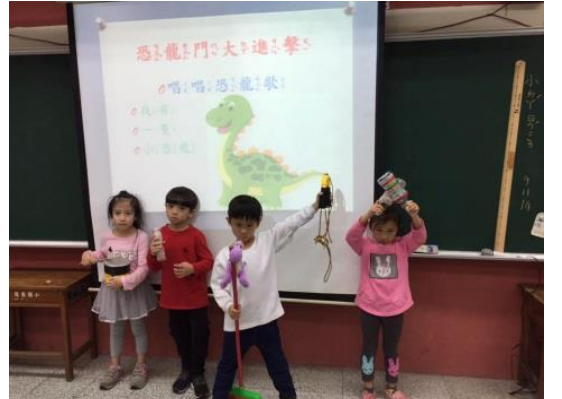
看看我們可愛的恐龍舞的英姿