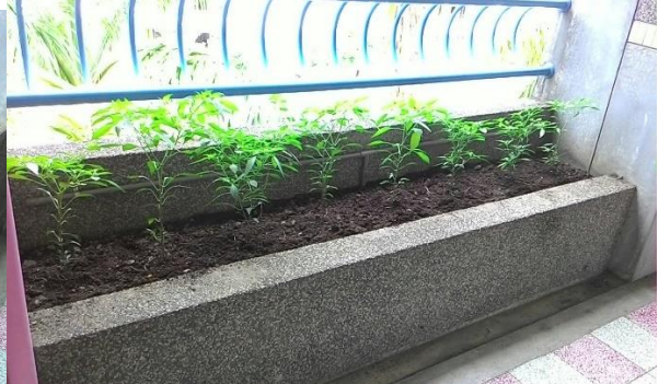
六年級辣椒的成長