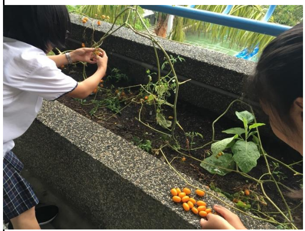
五年級收成小蕃茄