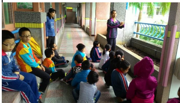
四年級農事專家解說種植 導師也一起學習