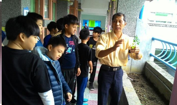
六年級農事專家教導種植