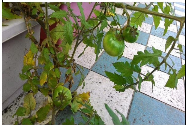
四年級蕃茄的收成