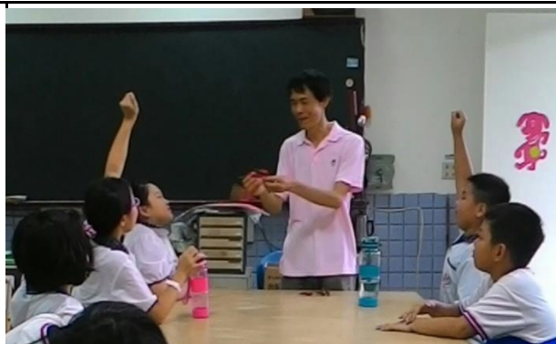
老師講解農作物成長