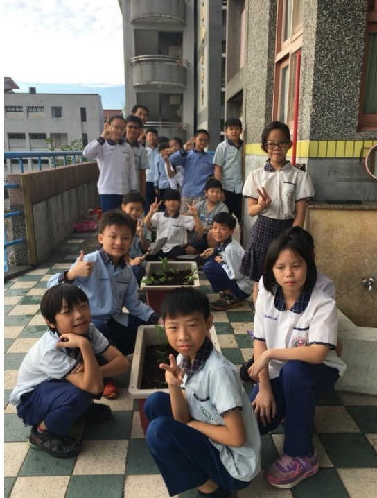
四年級學生種植菜苗