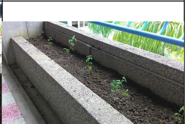
五年級蕃茄的成長