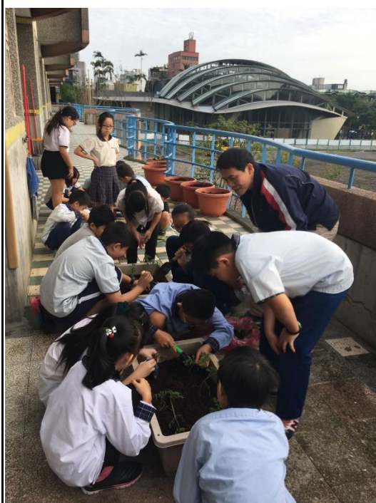
四年級學生種植菜苗