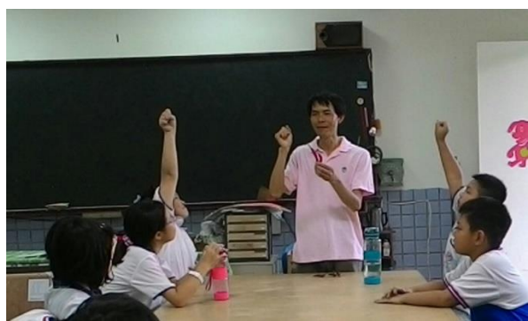
三年級學生發表農事經驗