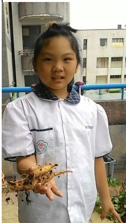
三年級地瓜種植經驗不足收成幾條