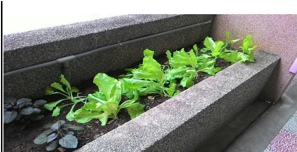
三年級種植大陸萵菜