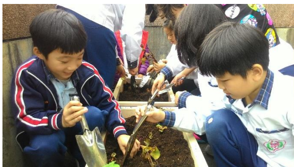
三年級種植地瓜苗