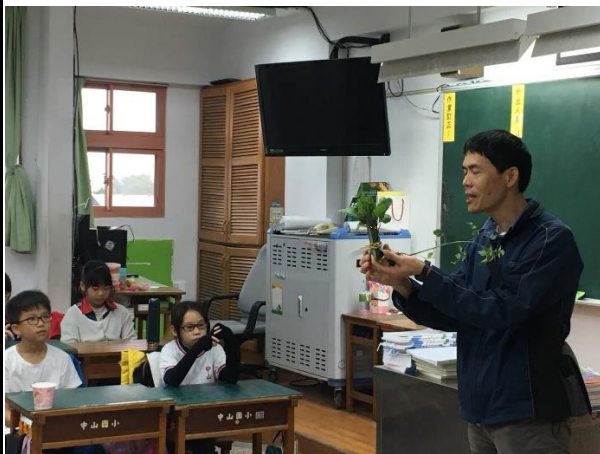
五年級種植蔬菜解說