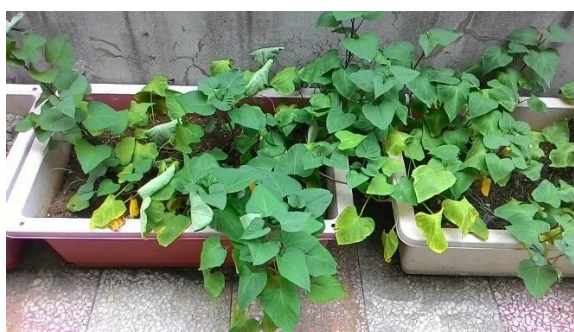
三年級種植地瓜的生長情況