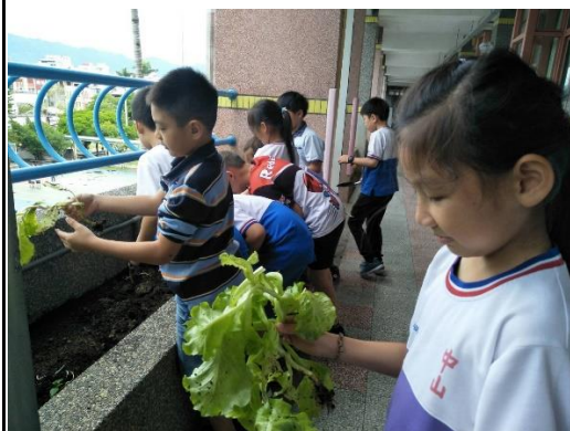
三年級採收大陸萵菜