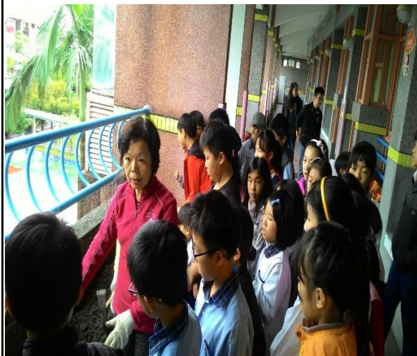
五年級農事專家教導學生種植方式