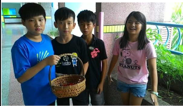
六年級辣椒收成採集