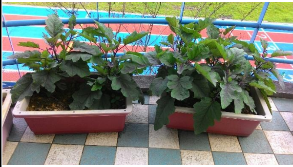
四年級茄子的成長