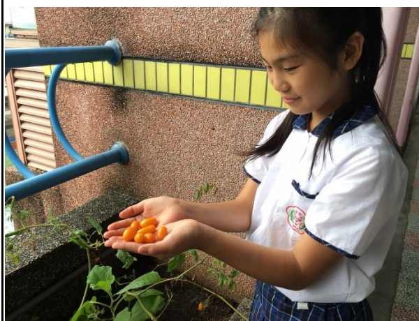
五年級收成小蕃茄