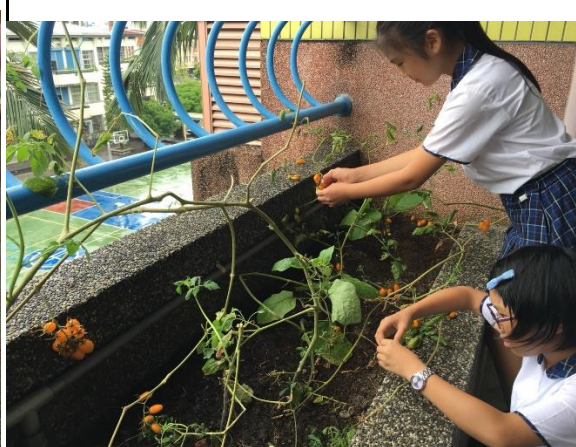
五年級收成小蕃茄