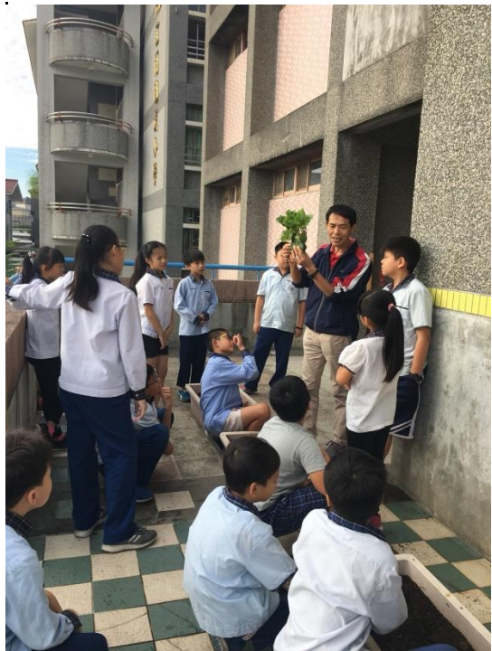
四年級老師解說茄子種植事項