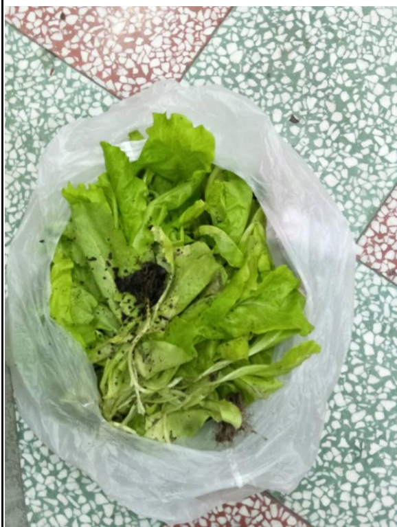
三年級大陸萵菜收成豐收