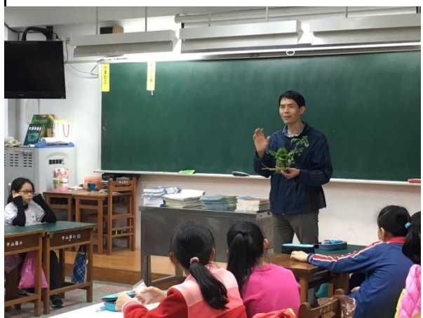
五年級教育農園推動的目的說明