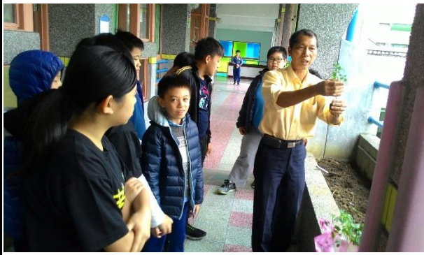
六年級農事專家解說和教導種植