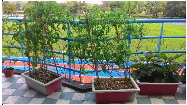
四年級蕃茄的成長