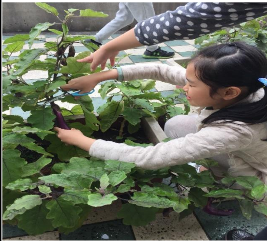
四年級茄子的收成