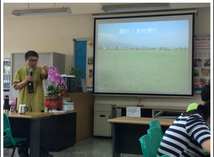
*藉由「食材旅行」談到「產銷履歷」，並