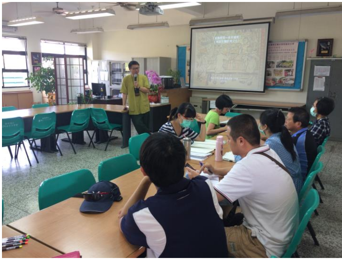
*講師由「食農教育—食在道地」兼談宜蘭飲食文化。