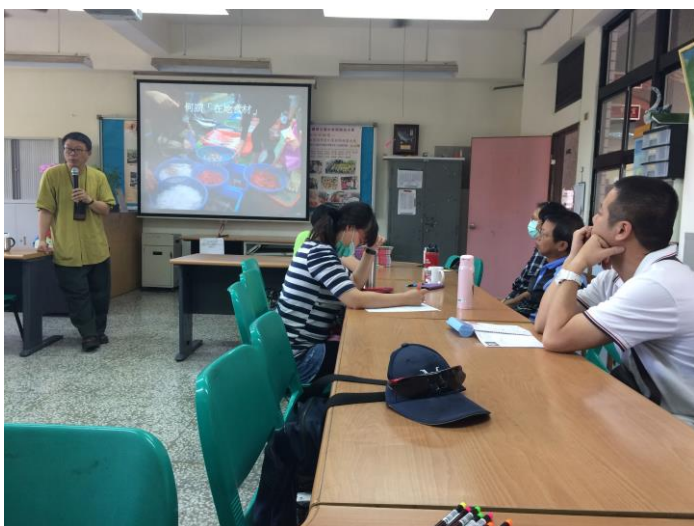
*講師帶領教師一同探討何謂「在地食」