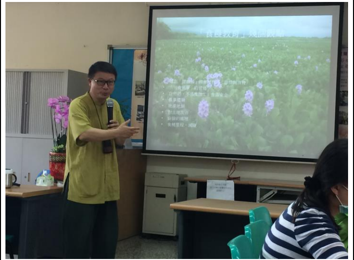
*講師透過電影「總鋪師」帶領大家一同探討食農教育的觀點。