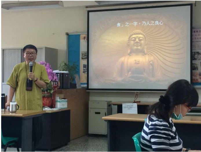
*健體領域之食農教育主要探討「食」部分，讓現場教師思考何謂「食」—人之良心。