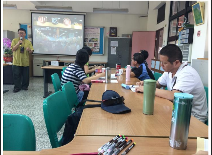
*由台灣特有飲食文化—小吃街，省思夜市生活及食安風暴。