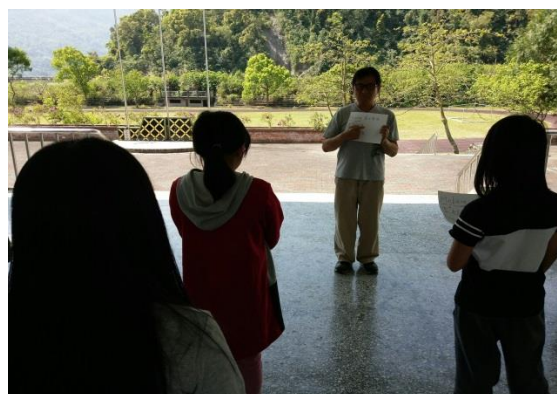
大家一起跟老師學習發音