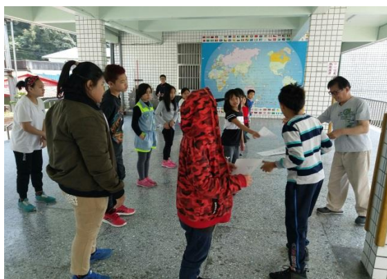
日昌老師發講義給小朋友