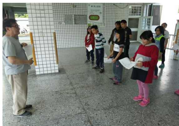
學生們認真的在聽日昌老師的講解