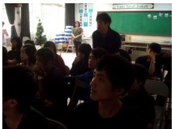
100.5.20/視聽教室/講師與同學互動