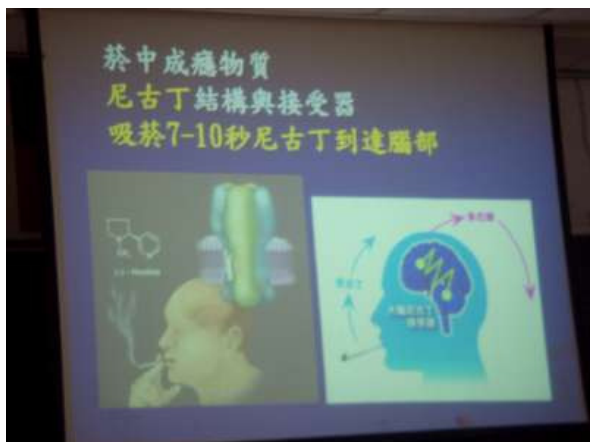
100.5.20/視聽教室/尼古丁對腦部的傷害