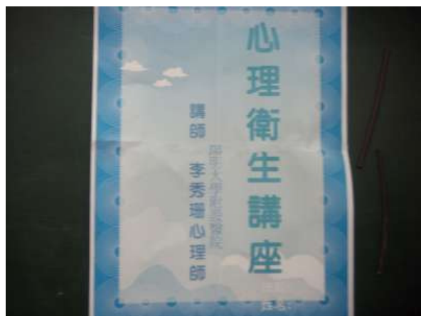
100.4.7/視聽教室/主題介紹