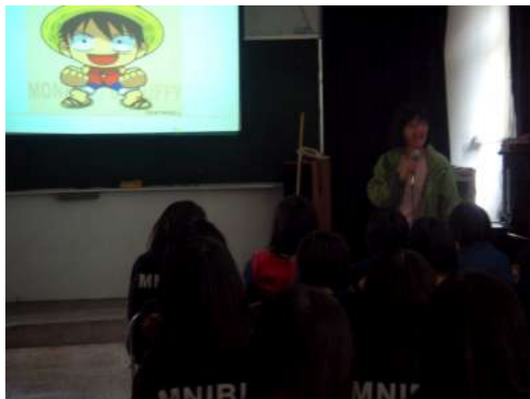
100.4.7/視聽教室/以航海王故事引言