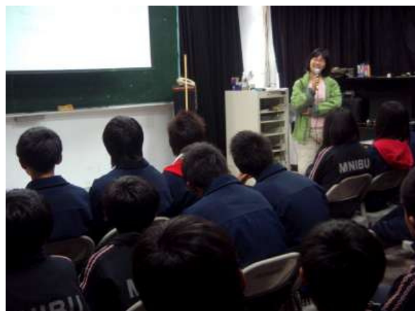
100.4.7/視聽教室/講師與學生輕鬆對談