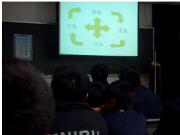
100.4.7/視聽教室/行為理論模式