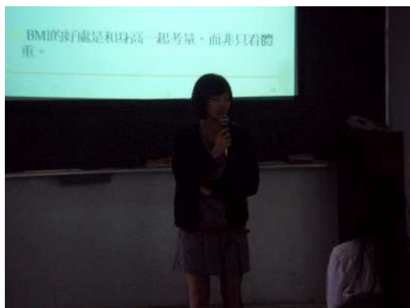
99. 12. 02/視聽教室/學生專注聆聽