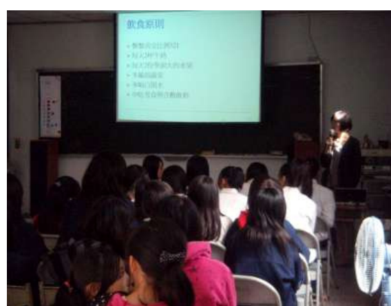
99. 12. 02/視聽教室/BMI 算法講解