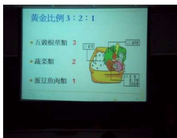
99. 12. 02/視聽教室/食物範例