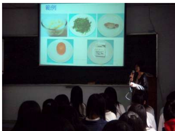
99. 12. 02/視聽教室/講述飲食原則