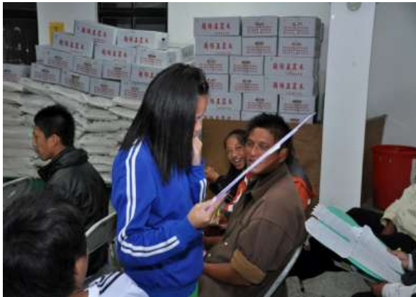
說明：學生親自對嚼檳家長說出「給家長的一封信」