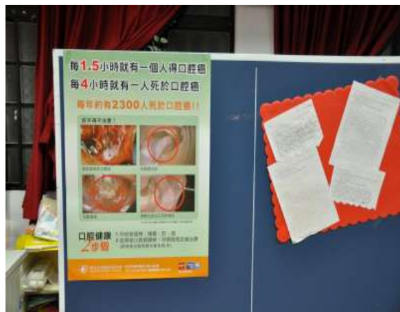
說明：部落社區中心張貼拒檳文宣，營造無檳社區環境。