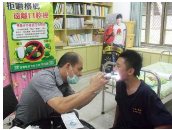
說明：鄉衛生所溫主任協助全校師生行口腔黏膜檢查