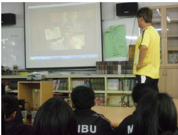
說明：健康與體育教師將無檳校園融入課程教學