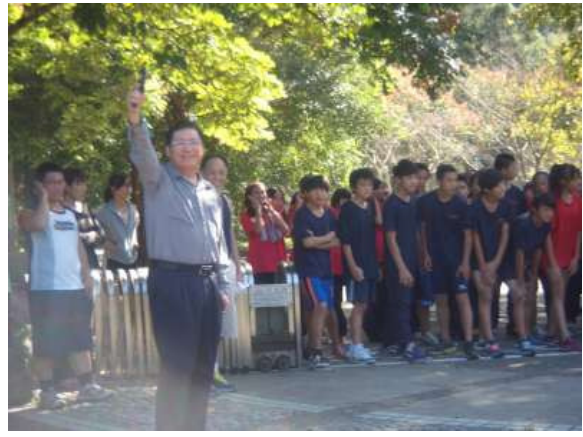
說明：校長主持無檳、拒菸、反毒校園健康路跑活動