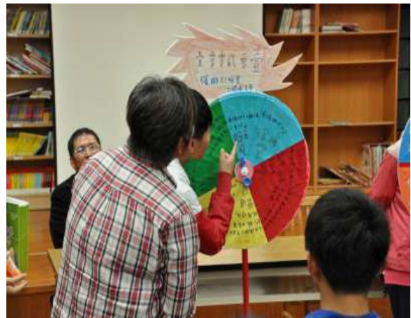
說明：親師座談會學生與家長玩转盤有獎徵答活動