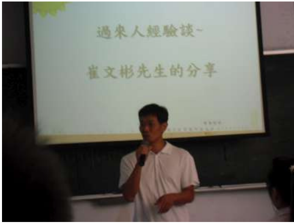
說明：「陽光基金會」口友蒞校分享拒檳經驗