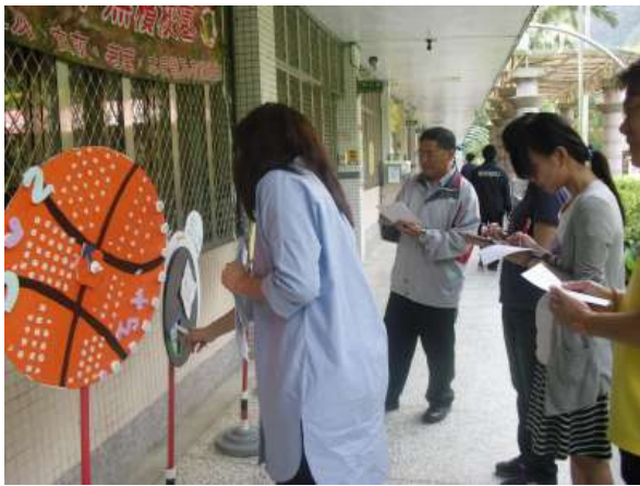
說明：校長及老師們協助轉盤設計競賽評比