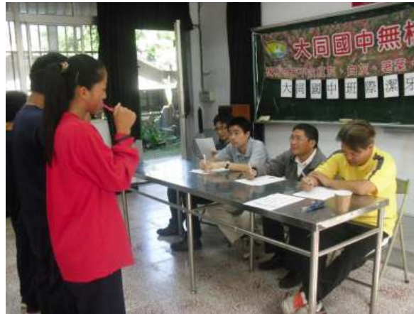
說明：舉辦無檳校園班際潔牙競賽