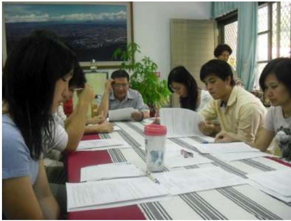
說明：拒檳小組會議