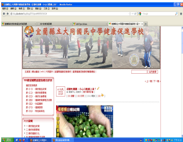
說明：將檳榔防制相關資訊發佈於本校健促部落格