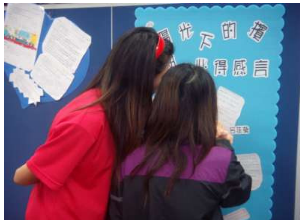
說明：學生們欣賞「陽光下的檳榔樹」心得感言