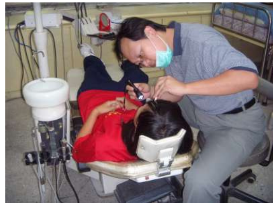
說明：陽大附設醫院牙醫師協助口腔檢查