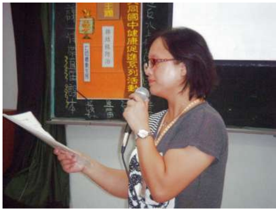
說明：大同衛生所行肺結核防治宣導