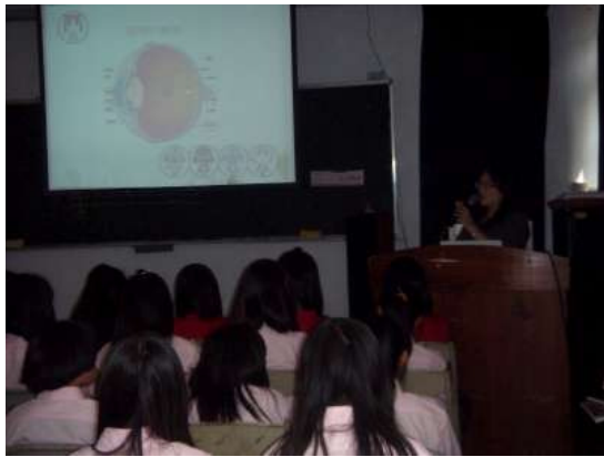
說明：聖母醫院眼科醫師視力保健演講