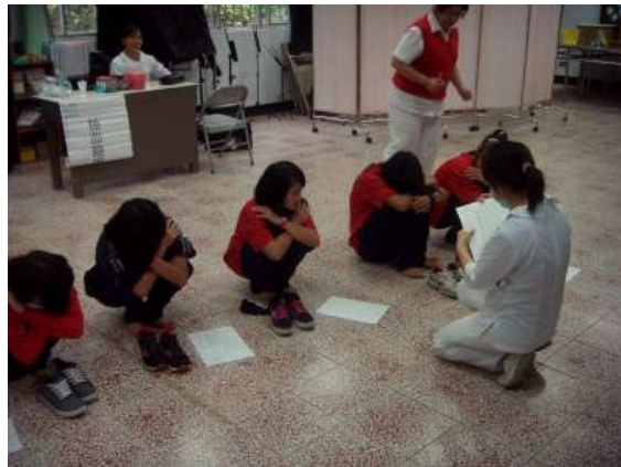
說明：聖母醫院協助健康檢查