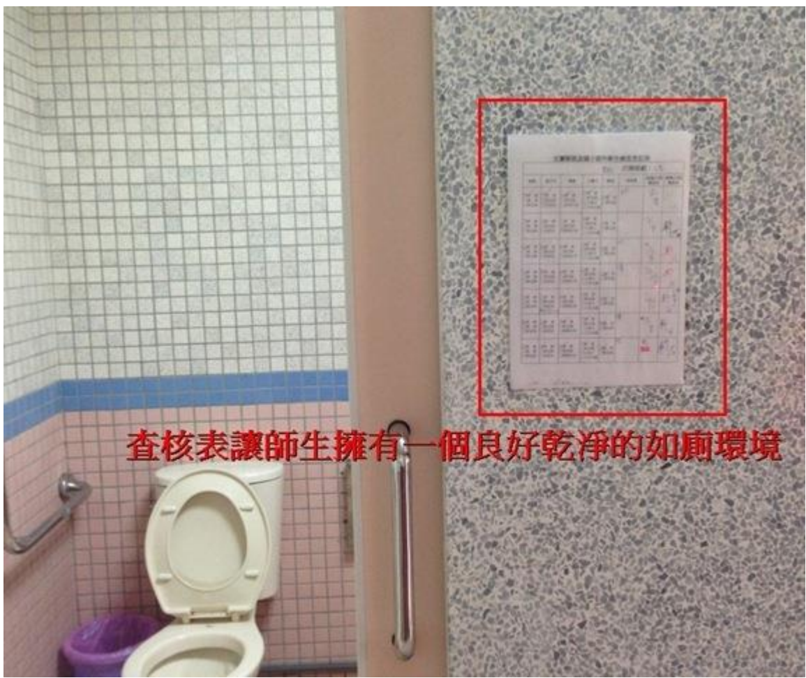
查核表讓師生擁有一個良好乾淨的如廁環境