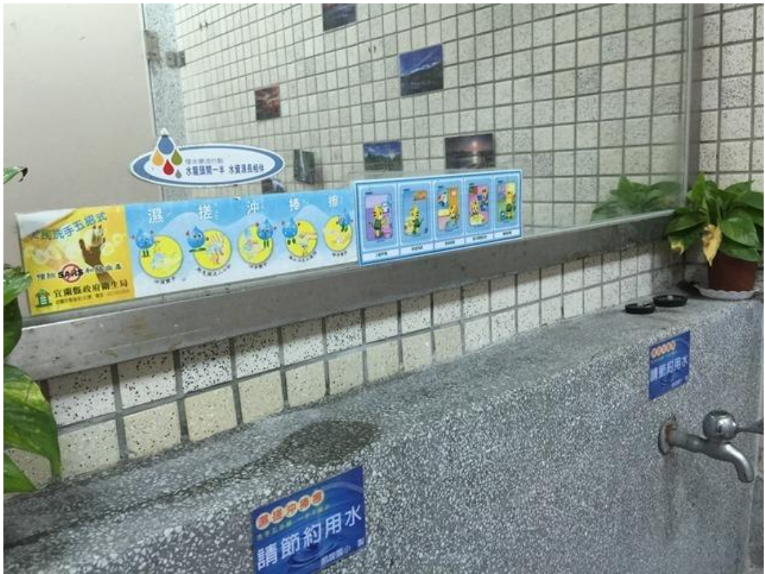
↑洗手台也維持的整齊又乾淨