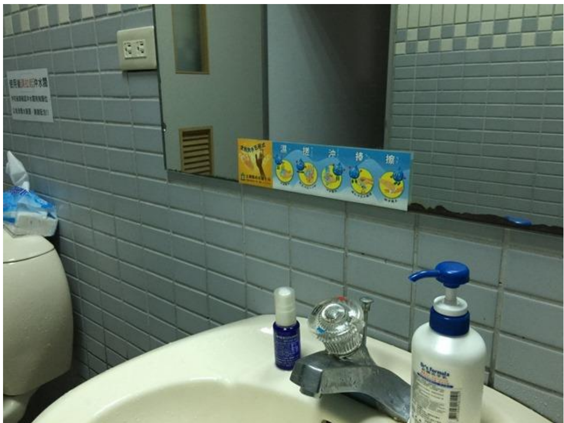
↑每個洗手台皆有黏貼省水及洗手五時機、五步驟標語