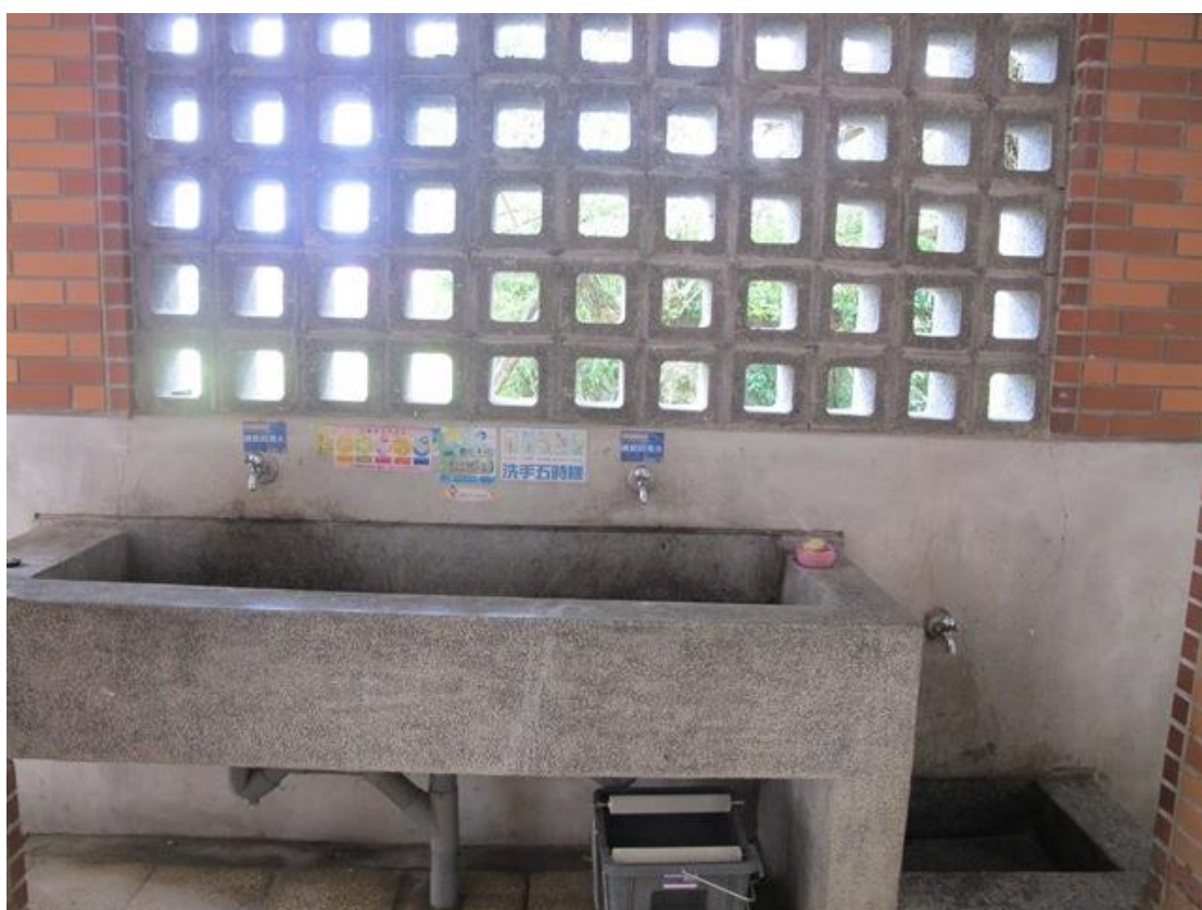
↑整齊又衛生的如廁環境