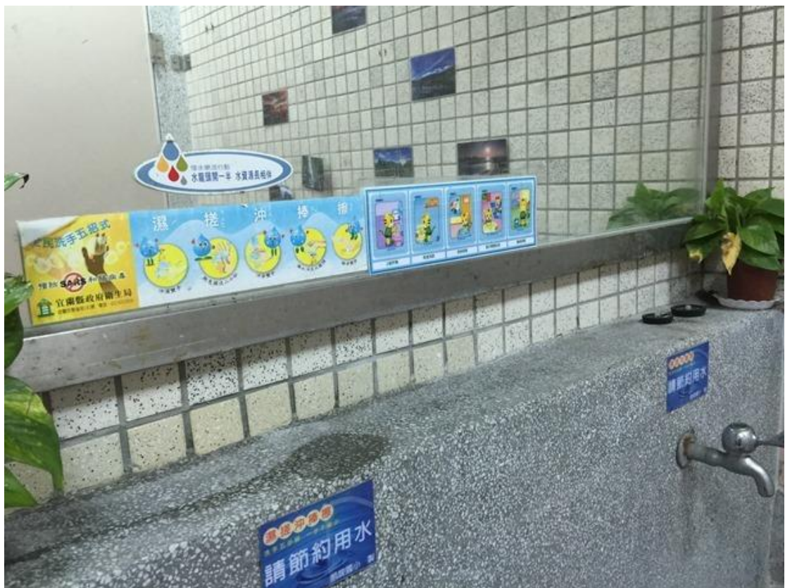
↑洗手台也維持的整齊又乾淨