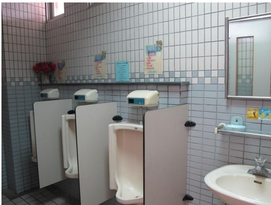
↑乾淨又舒適的如廁環境