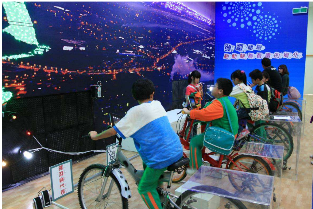
大家拚命地騎著腳踏車，看看能節省多少能源！