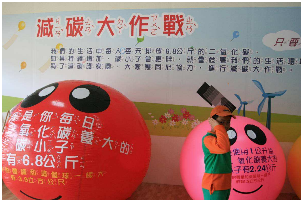
一進碳息工場就看到要我們節能減碳的大氣球