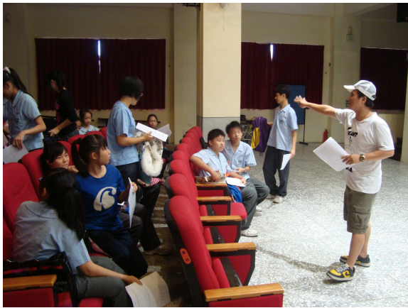
排練實況－導演分派角色