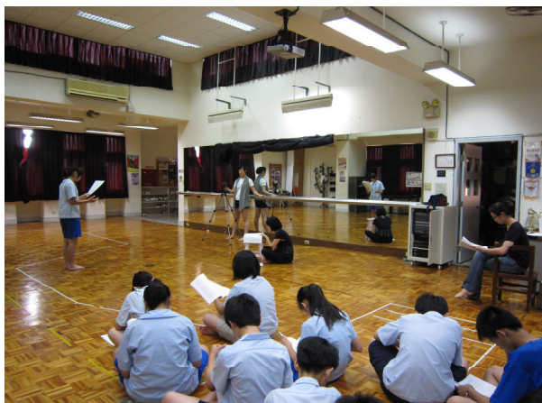
演員甄選－個人讀本