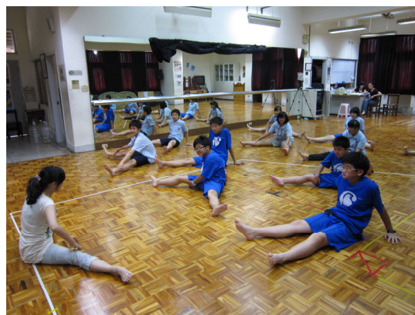
演員甄選－身體軟開度測試