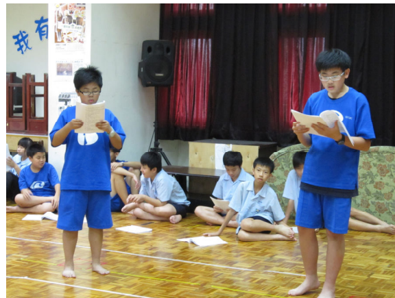
演員甄選－讀本測試