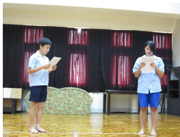
演員甄選－對詞測試