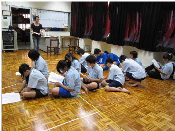
演員甄選－學生報到拿劇本