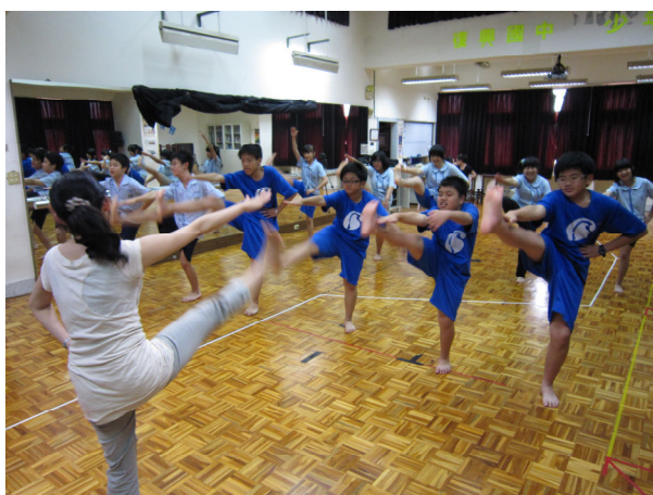
演員甄選－肢體活動測試