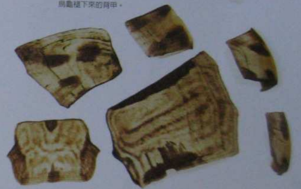
烏龜褪下來的背甲。