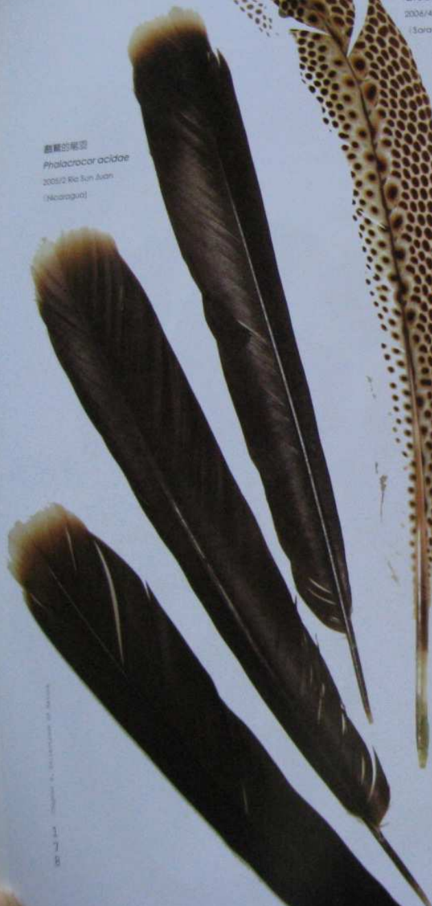
青鸚的飛羽 Great Argus 2006/4 Mulu (Sarawak, Malaysia)