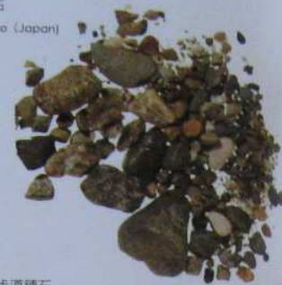
明治神宮步道鋪石 2001/9/10 Meiji Jingu (Tokyo, Japan)