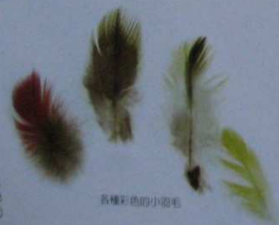
各種彩色的小羽毛