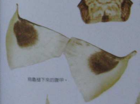
烏龜褪下來的腹甲。