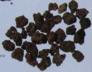
尼加拉瓜火山岩 2005/2 Conception Volcano (Ometepe, Nicaragua)