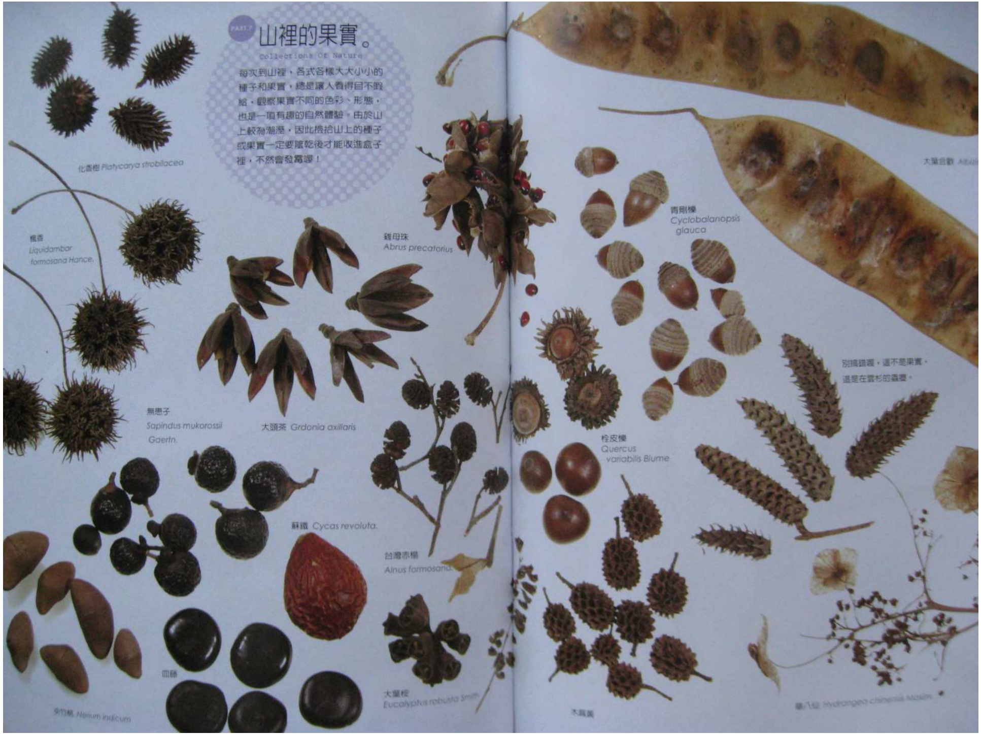
北香榧 Platykarya strobilacea

每次到山裡，各式各樣大大小小的種子和果實，總是讓人看得目不暇給，觀察果實不同的色彩、形態，也是一項有趣的自然體驗。由於山上較為潮溼，因此撿拾山上的種子或果實一定要曬乾後才能收進盒子裡，不然會發霉喔！