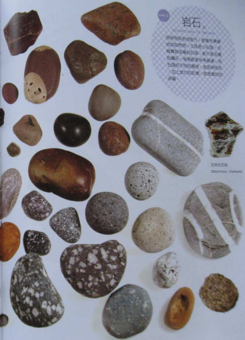
石林石環岩 2004/4 Muhi (Malaysia)

我時常到各地旅行，都會收集各地的自然物，尤其是小石頭。仔細看我收集的石頭，都不是名貴的寶石，每個都是非常普通，但石頭的不同的質感、造型與色彩，加上旅行的記憶，就是最佳的收藏品。