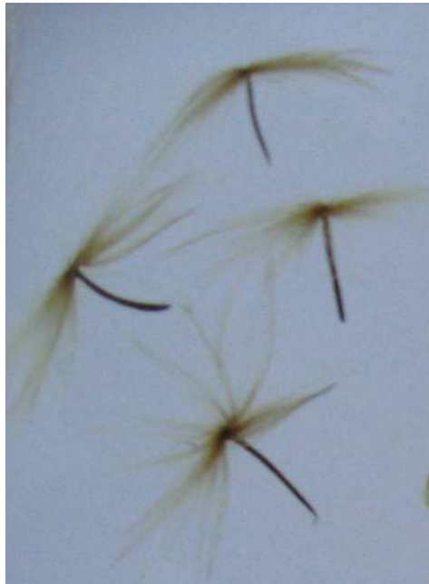
刺云葉草形 Aristida cunninghamii

看到這些風媒種子，你大概就 會知道它是用什麼方式傳播了把！ 這些種子，可以藉由風把牠們 帶到遠處的那一剎，因為牠 們承載了一個輕巧的飛機。這 些種子的薄翅非常容易破裂，在 吹風時會碎掉而已。