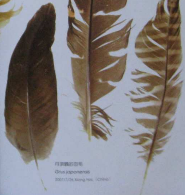
丹頂鶴的羽毛 Grus japonensis 2007/7/26 Xiang He, (China)