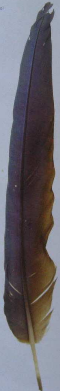
藍黃金剛鸚鵡 Ara ararauna 飛羽正面