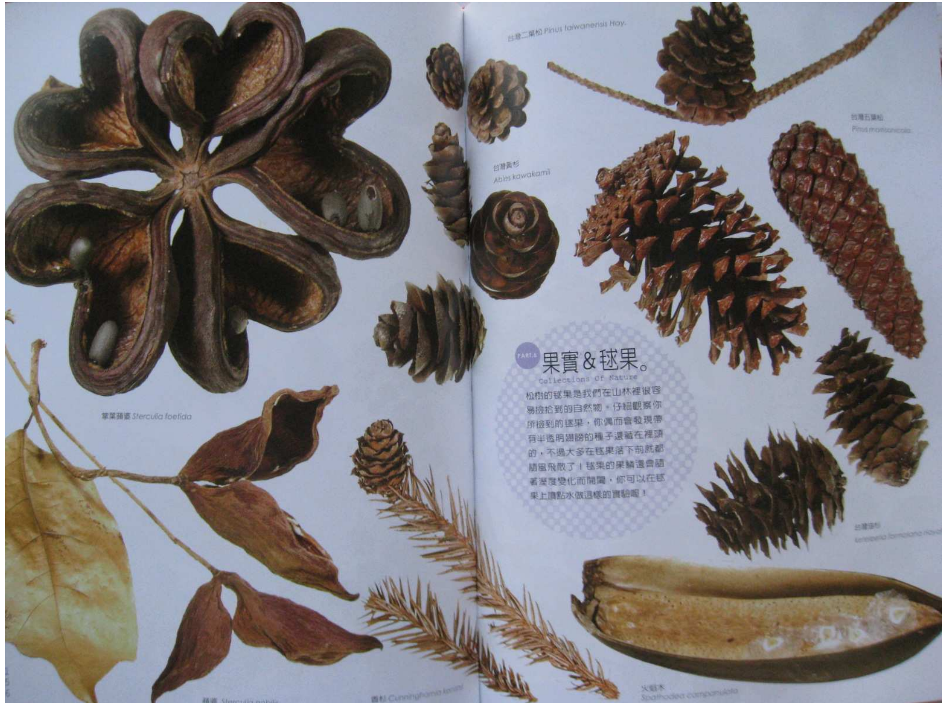
台灣二葉松 Pinus taiwanensis Hay.