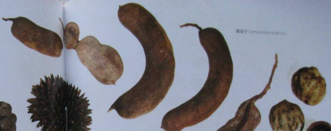
真貝子 Tonivindia Indica L.