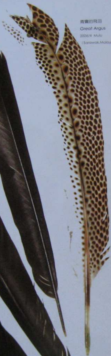
青鸚的飛羽 Great Argus 2006/4 Mulu (Sarawak, Malaysia)