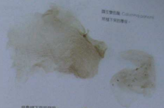
烏龜褪下來的背甲。