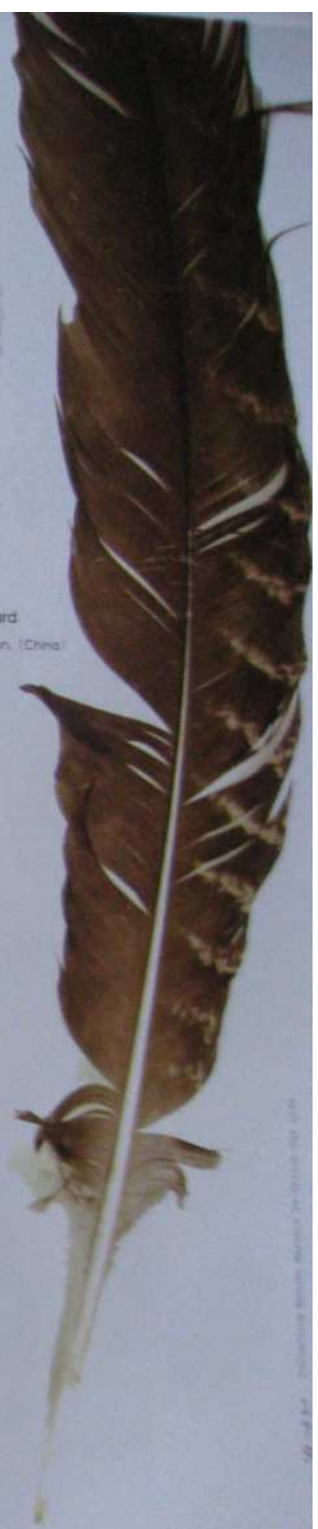
大鵬的羽毛 Great bustard 2007/8 Sichuan, (China)