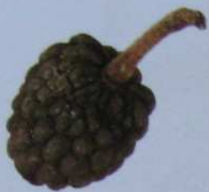
釋迦 Sweet Sop

這幾年收集自然物的過程裡，常有意外收穫。像乾燥的樟樹就是有人採在台東卑南溪出海口撿到的紀念物。這些水果平時一放久了就爛，但有些經過了日曬或沸水燙泡，反而成了不容腐爛狀的「乾果」，十分特別。