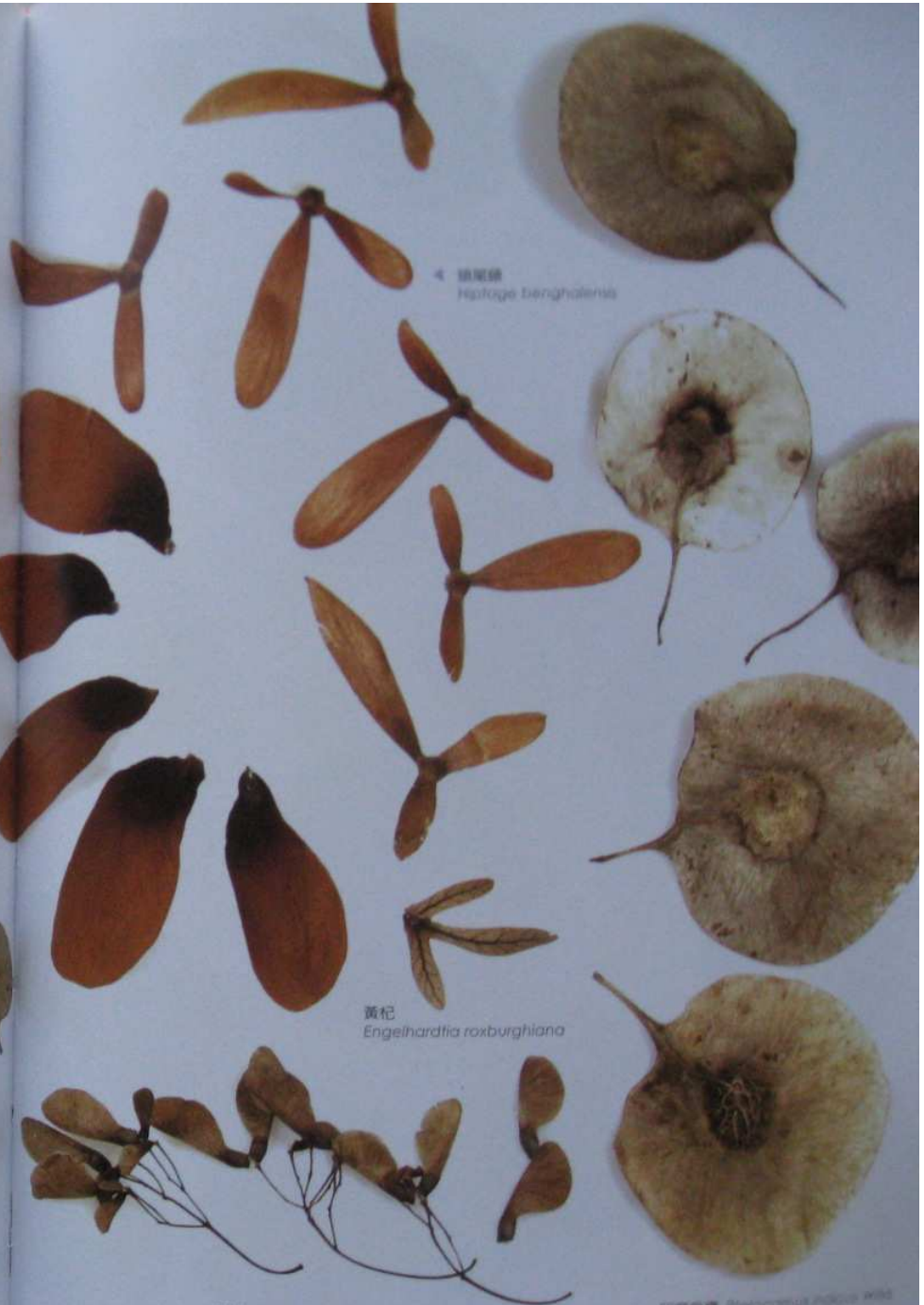
4 翅果類 Histage benghalensis