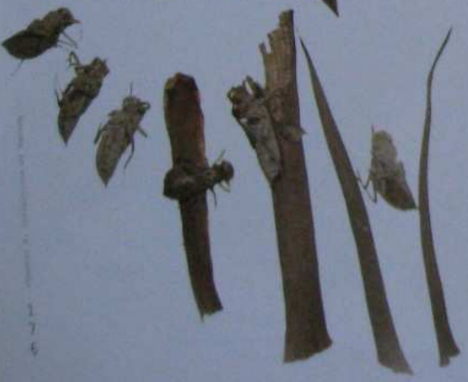
精細的幼蟲—水黽的褪殼。