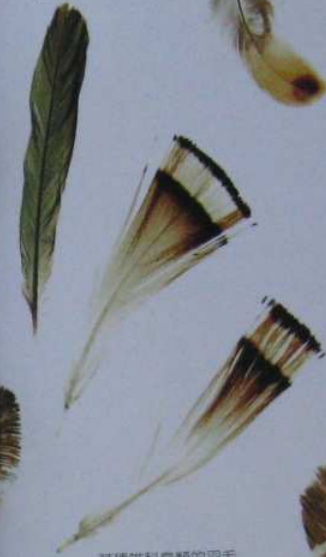
某種雉科鳥類的羽毛