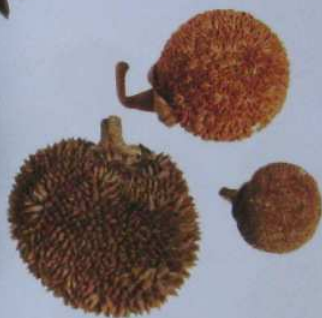
波羅蜜 Jack Fruit