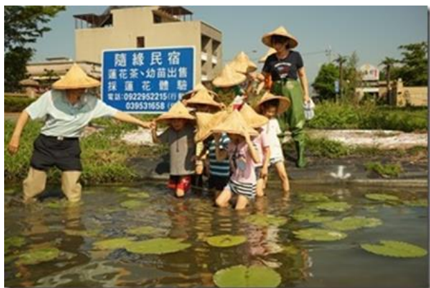
荷園水生植物觀察採摘