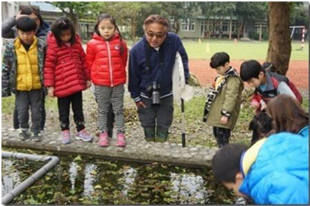
邀請荒野講師到校講解昆蟲生態