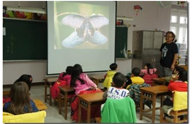
課堂分享昆蟲知識