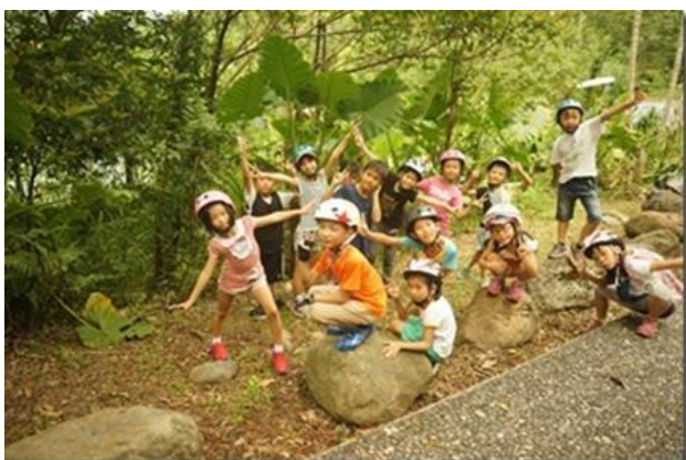
騎單車環遊梅花湖觀察種子花朵昆蟲