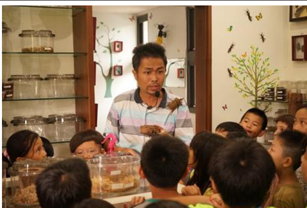
甲蟲生態教室標本實物說明