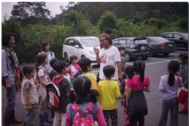
校外小旅遊瞭解昆蟲生態