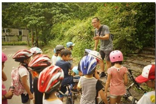
教師介紹植物動物生態