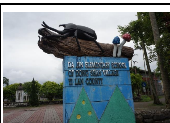
校門裝置藝術完工圖