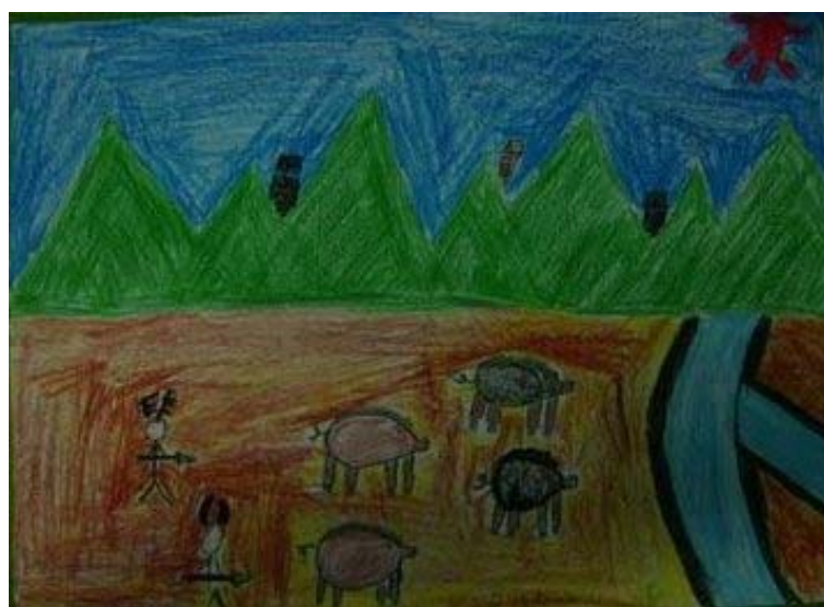
作品名稱：打獵 作者：王志杰