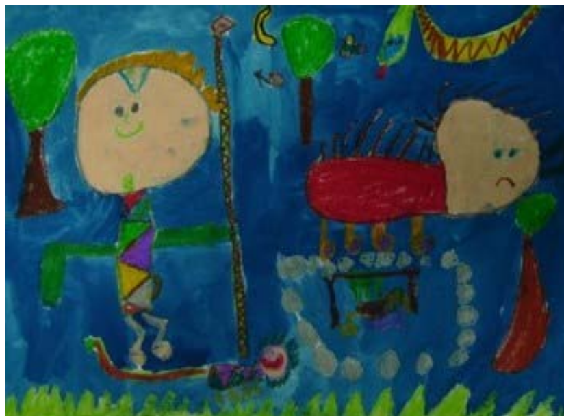
作品名稱：射山豬 作者：俞捷