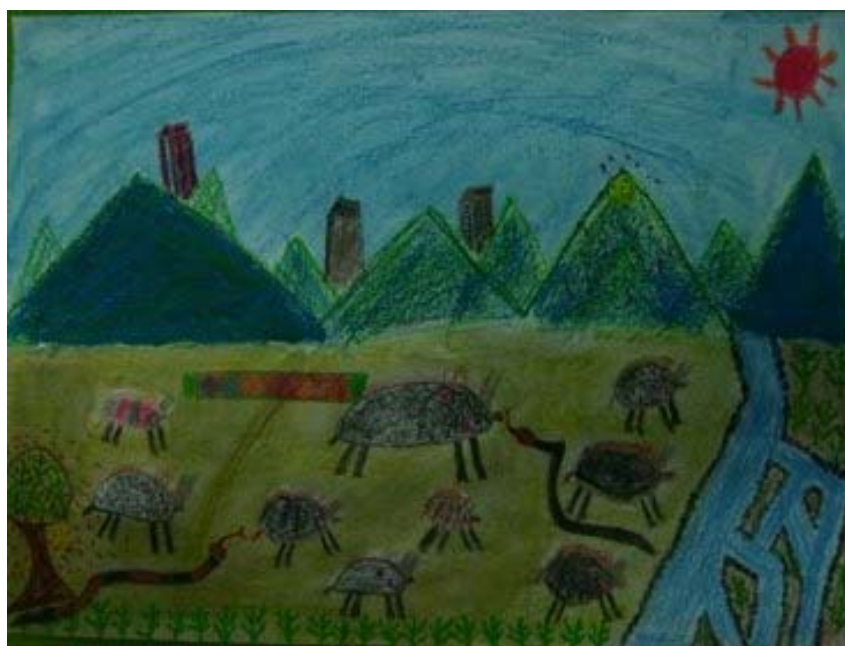
作品名稱：原始泰雅 作者：趙函