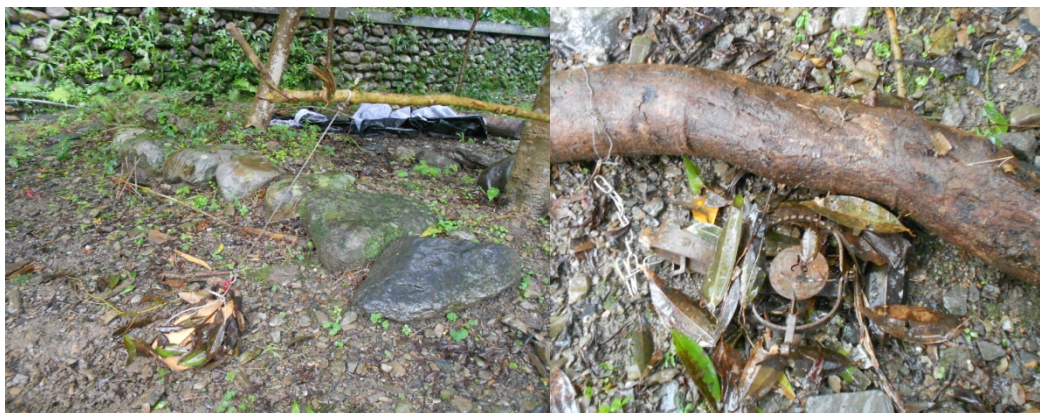
此陷阱獵捕體型較大的山豬、山羌、山羊等