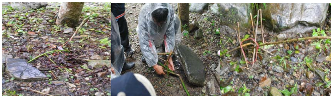
此陷阱獵捕體型較小的老鼠、鳥類、雉雞等