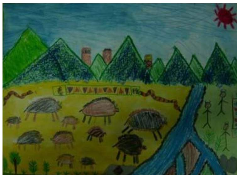
作品名稱：山豬的家園 作者：莊思逸 〈獲第三屆全國原住民兒童繪畫比賽中年組佳作〉