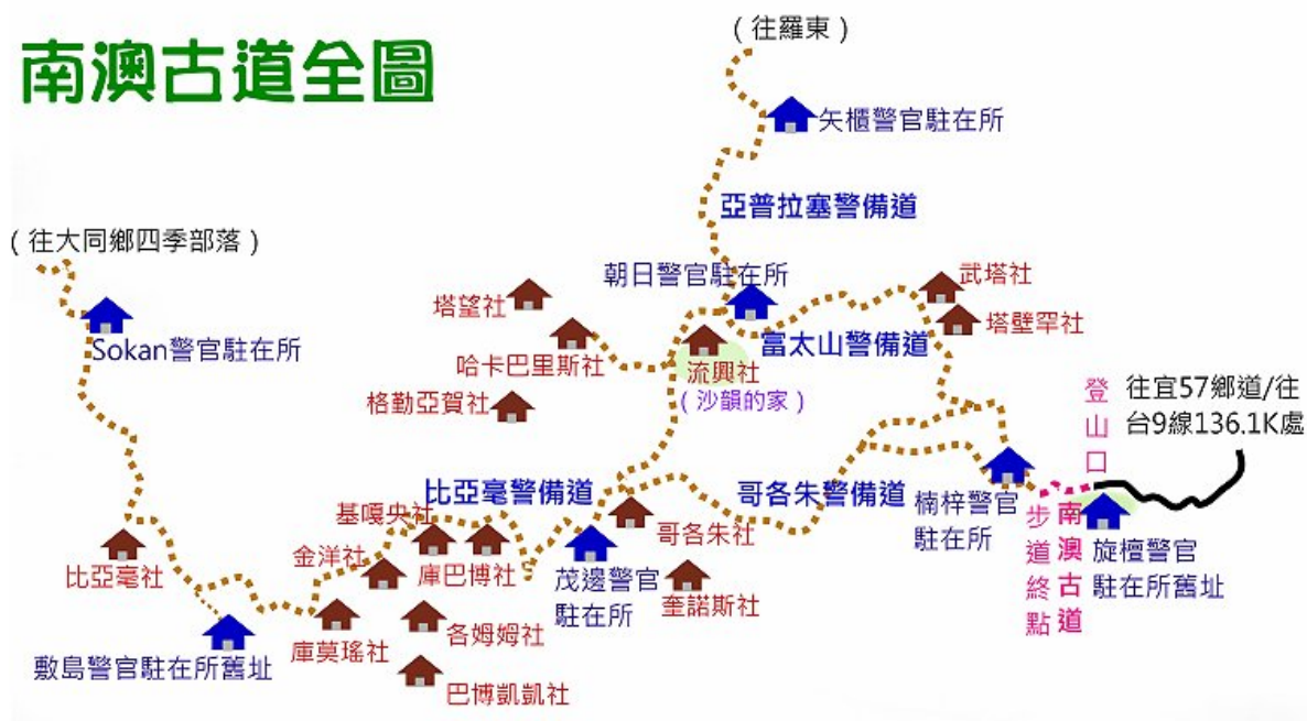
《南澳警備道路地圖