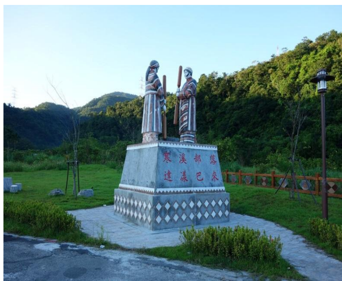
四方林聚落入口意象