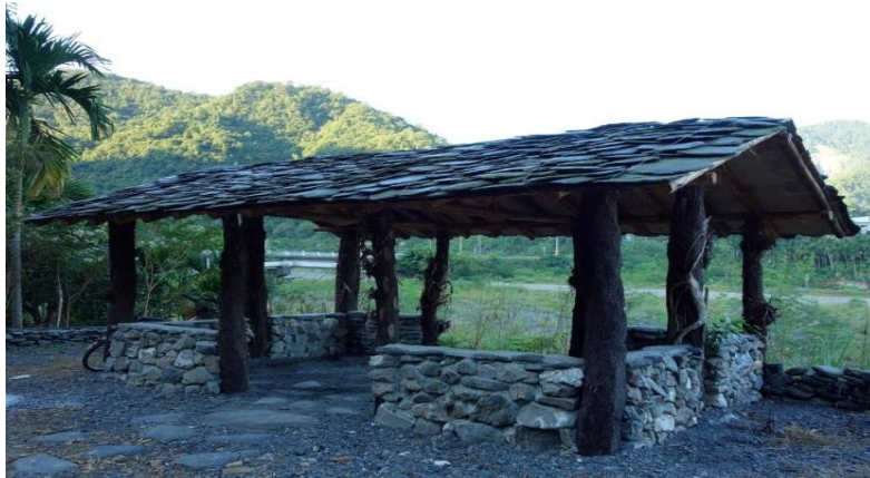
寒溪入口意象—石板屋

寒溪聚落 或 stacis(司達吉斯) ，有學校、村辦公室、派出所、衛生所、社區發展協會、托兒所、活動中心、籃球場、基督長老教會、天主堂及郵局電信代辦處，為本村的行政中心，此外 寒溪吊橋 、 寒溪神社 也成為了 寒溪部落 著名的觀光景點。