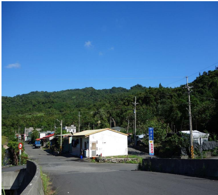
興 レ 華 レ 興 レ 聚 ル 落 ル 街 ニ 景 ニ 圖 ニ

興 レ 華 レ 興 レ 以 レ 前 ク 叫 ハ 做 ル 「古 レ 魯 カ 」，對 テ 泰 カ 雅 カ 語 カ 來 ル 說 ル 也 セ 有 ル 「盒 レ 子 チ 」的 ル 意 ハ 思 ム ，因 ニ 為 ス 以 レ 前 ク 古 レ 魯 カ 居 ル 住 ル 的 ル 環 レ 境 ハ 像 テ 一 ト 個 ノ 盒 レ 子 チ ，四 ハ 面 ハ 八 ツ 方 ニ 都 ク 被 ル 山 ニ 包 ム 圍 ル 住 ル 了 ル ，所 レ 以 テ 做 ル 叫 ハ 「古 レ 魯 カ 」。行 レ 政 カ 區 ニ 命 ル 名 ル 為 ス 興 レ 華 レ 興 レ 巷 チ 。而 ル 另 カ 一 ト 遷 ル 移 ル 的 ル 說 ル 法 ニ ，則 レ 是 ル 據 ル 耆 ノ 老 カ 口 ニ 述 ル ，因 ニ 居 ル 住 ル 環 レ 境 ハ 長 キ 年 ヲ 照 ル 射 ル 不 ク 到 ル 陽 ニ 光 ニ ，聚 ル 落 ル 中 ニ 發 ル 生 ル 虐 シ 疾 ニ ，因 ニ 而 ル 遷 ル 到 ル 現 レ 今 ニ 聚 ル 落 ル 。