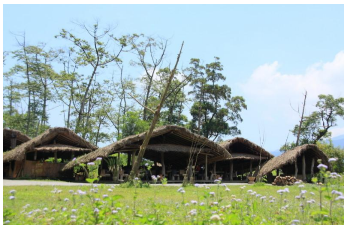
富有泰雅文化的「不老部落」