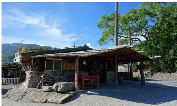
部落族人經營有特色的「巴萬角」

從寒溪聚落通過寒溪吊橋，華興聚落種植多樣果樹，如桃子、李子、柳橙、柑橘、芭樂及柚子，一年四季不缺水果，「不老部落」、「寒碧園」、「巴萬角咖啡屋」…等，都是通往華興聚落遊憩的好地方。