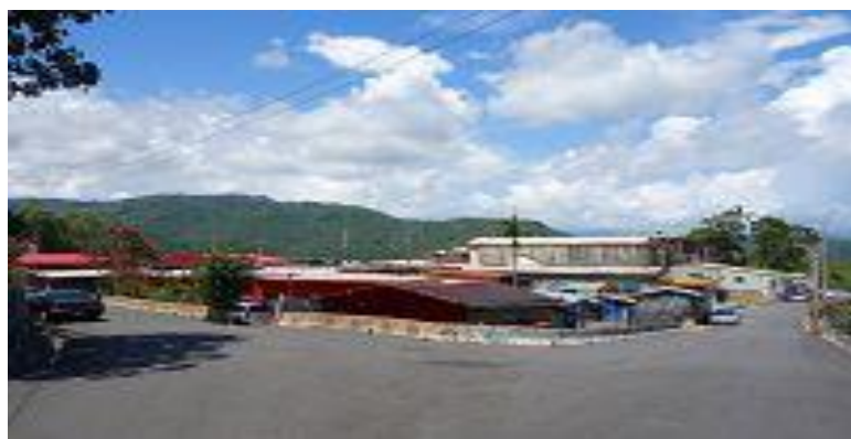
現今四方林聚落-自強新村