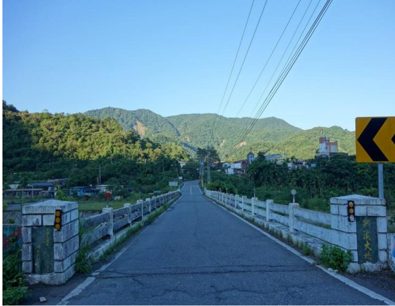
通往寒溪聚落——寒溪大橋

寒溪又叫 stacis(司達吉斯) ，因寒溪經常下雨，雨聲「吉斯… 吉斯…」因而得名。