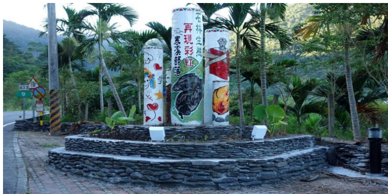
寒溪特色入口意象