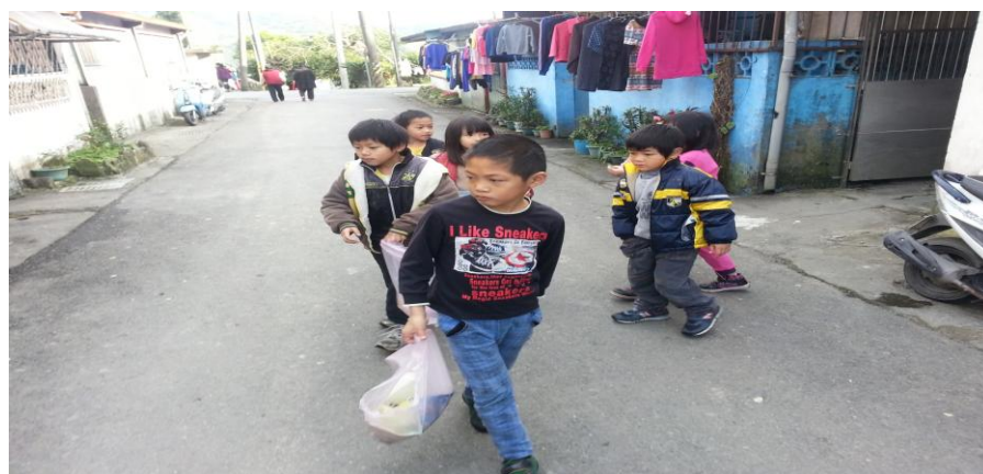
新光聚落街景一圖