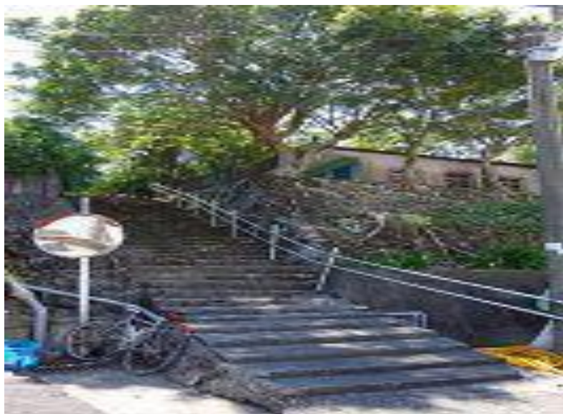
通往四方林分校及天主堂

民國47年9月又增設四方林分班，六年後成立分校，民國72年因人數關係，裁併到本校。