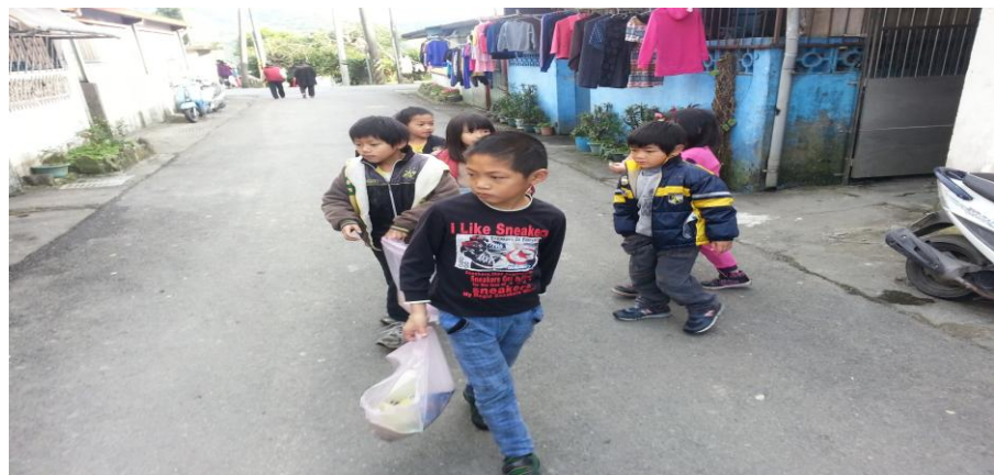
新光聚落街景一圖