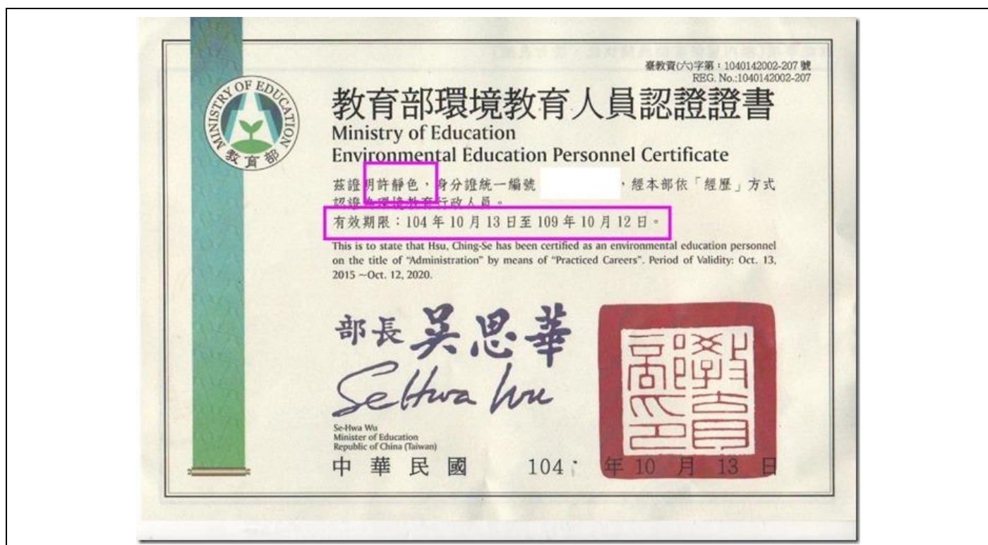
許靜色主任環境教育人員認證證書