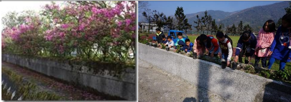
學校利用社區資源種了許多杜鵑花樹，在操場周圍，以及廣場通往辦公室的樓梯小土丘上；學校無高牆，連矮牆也綠化成杜鵑花花牆。