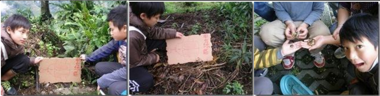
甲蟲區：以落葉堆肥區吸引甲蟲前來產卵，做生態觀察（金龜子和鍬形蟲）。