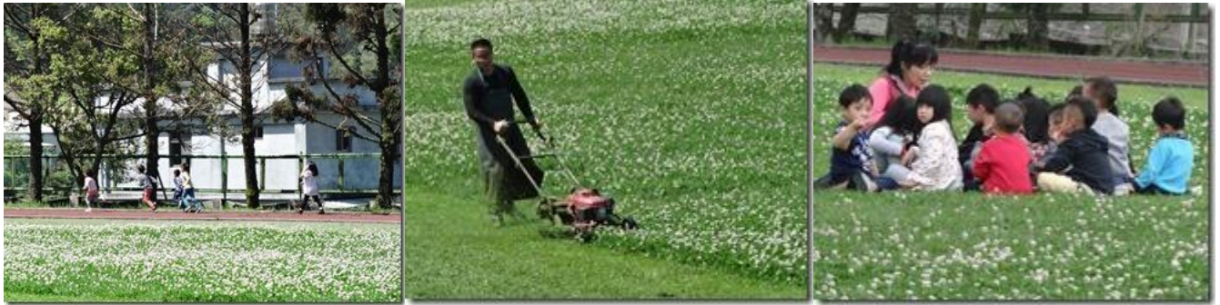
校園不灑除草劑、草皮美到會開花