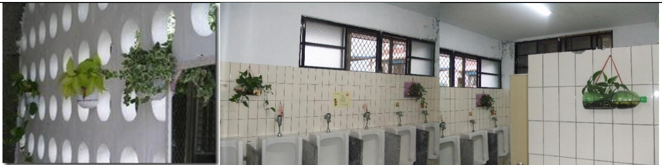
走廊及廁所放置盆栽綠美化，廁所的盆栽利用回收品製成的花器來種植物