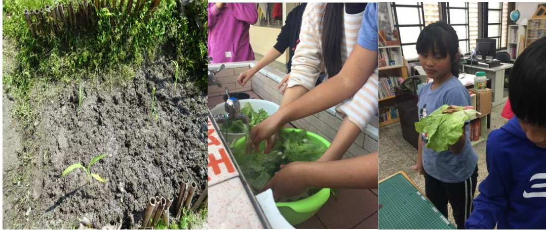
近年學生更利用自然坡度，闢建成「食農教育」梯田；六月收成，自己吃的蔬菜自己種。