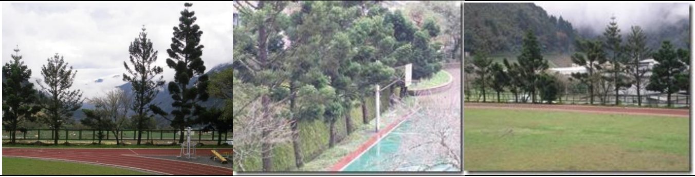
滿眼綠意的校園:杉木區-肯氏南洋杉、柳杉。