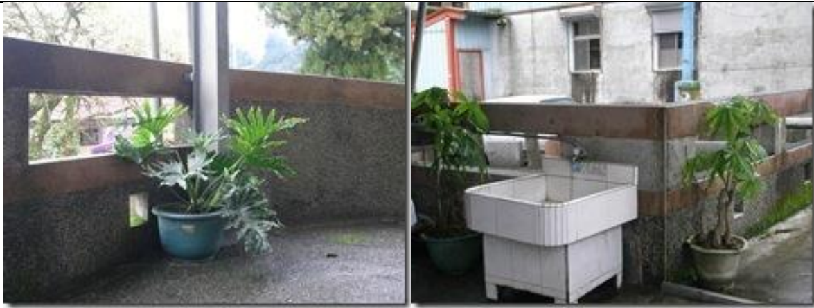
景觀花園：教室、廣場前的綠美化。