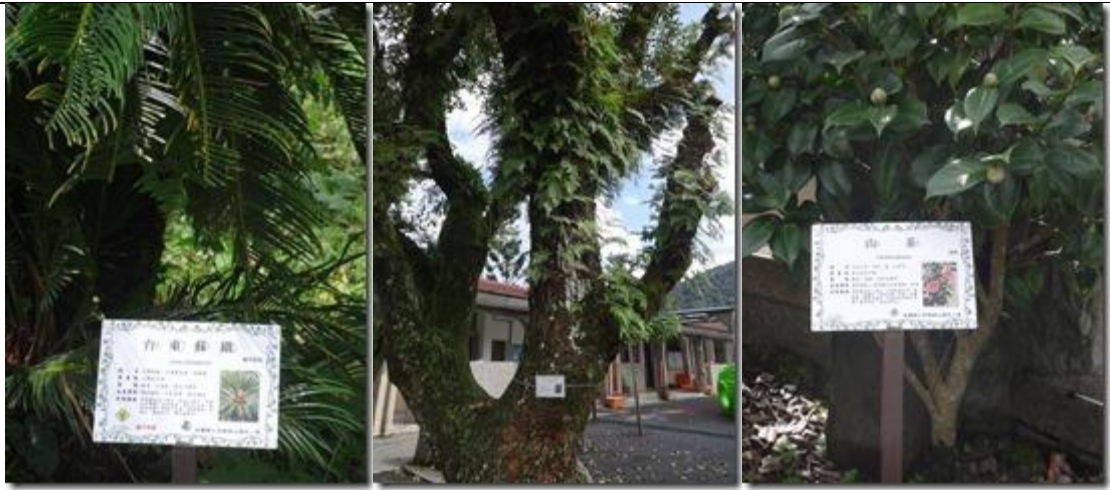
校園周圍也種植了許多植物，並設立解說牌。