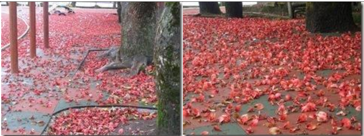
特定季節景觀區：五月底六月初雞冠刺桐落花特地不掃，維持特殊景觀。