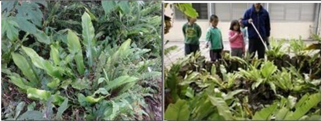
辦公室外以及停車場水塔附近，利用社區資源規畫了園藝區。利用山區的山蘇(原住民常用食物)規劃出來的。