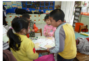
分組討論想要進行觀察的地點