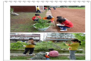
觀察並紀錄校園裡的花