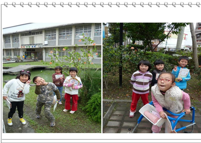
觀察並紀錄校園裡的花

春天的腳步漸漸接近，也增加了許多美麗的花朵妝點著中興國小的校園。在生活課程中，我們認識了許多常見的花卉。趁著一個晴朗的好天氣，讓一忠寶貝們分組討論想要觀察校園哪一個角落的花朵，達成共識後就各組出發囉！孩子們分別跑到了遊戲器材區，觀察大花咸豐草；四年級教室前方，觀察到了朱槿；幼稚園涼亭附近，觀察朱槿及紫藤；停車場附近，開了美麗的茶花及杜鵑花。孩子們不但認識了花朵的名稱、觀察到花的樣貌，更重要的是：在分組過程中，學習到了互助合作的重要，及尊重每個組員發表意見的權益。爸比媽咪有空到學校時，不妨讓孩子牽著您們的手，逛逛瞧瞧校園裡美麗的花朵喔！(2011/4/5)