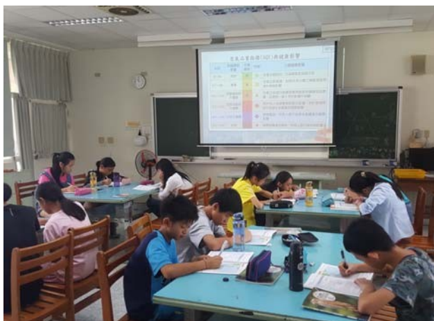
透過分組討論將空氣品質議題融入自然科教學課程