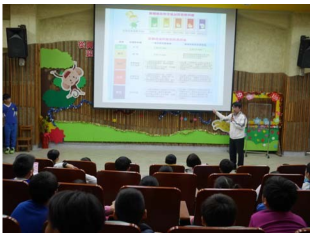
利用兒童朝會進行空氣品質宣導活動