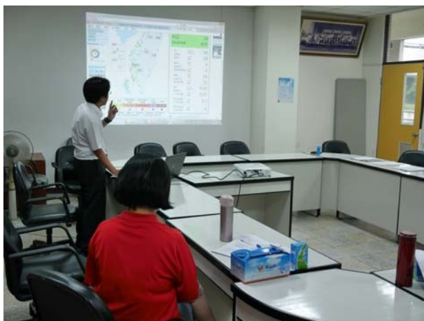
校長透過研習時間進行空氣品質議題宣導