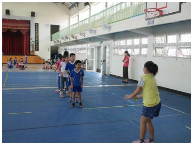
學校室內體育空間妥善規畫與運用