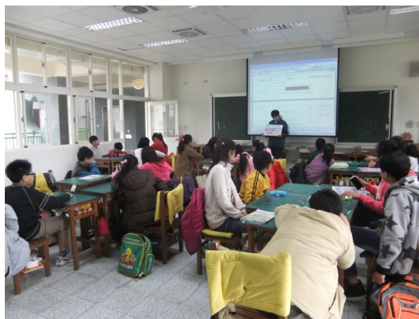
透過分組討論將空氣品質議題融入自然科教學課程