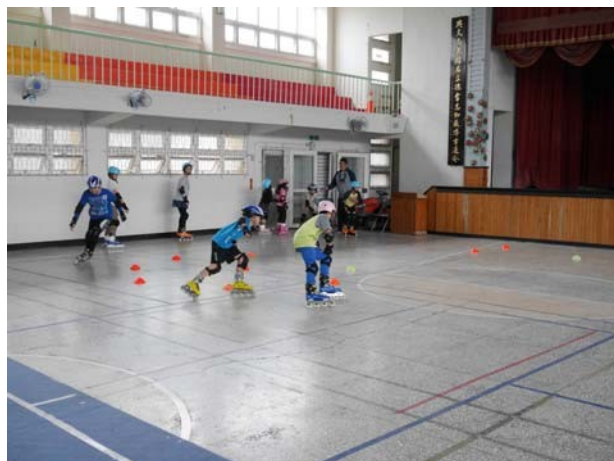
學校室內體育空間妥善規畫與運用