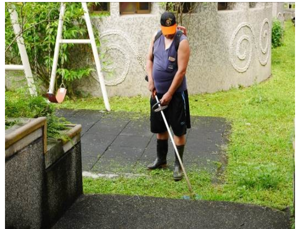
整頓校園環境衛生清除積水容器，消除登革熱病媒蚊孳生源