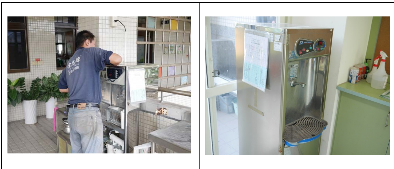
每台飲水機皆有完整的管理及維護保養紀錄