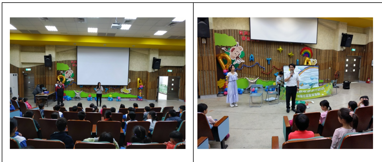
利用兒童朝會及活動宣導強化節能減碳觀念