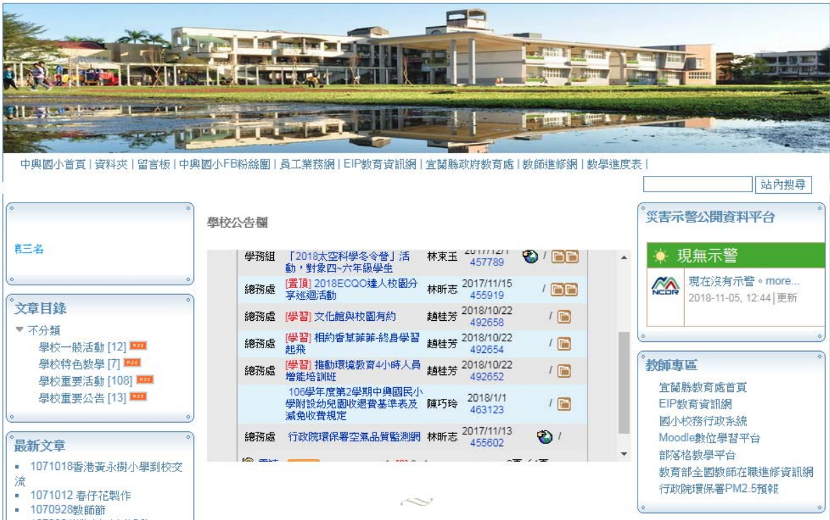
利用學校網頁將環境教育活動及訊息進行公告