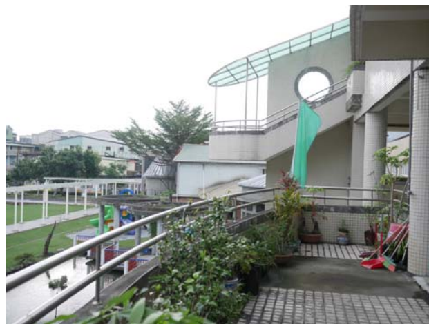
校園公共空間懸掛空氣品質旗幟 提醒全校師生當天空氣品質指標 AQI