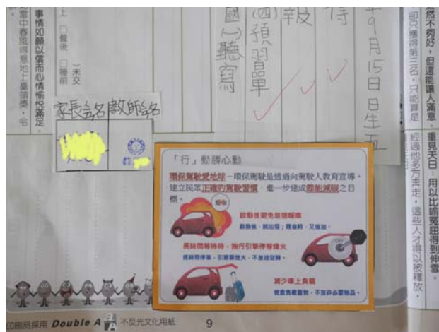
利用班親會、朝會及聯絡簿向家長及學生進行節能減碳及停車怠速熄火