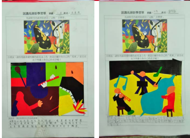
▲學生欣賞艾瑞卡爾的作品並發表自己的想法。