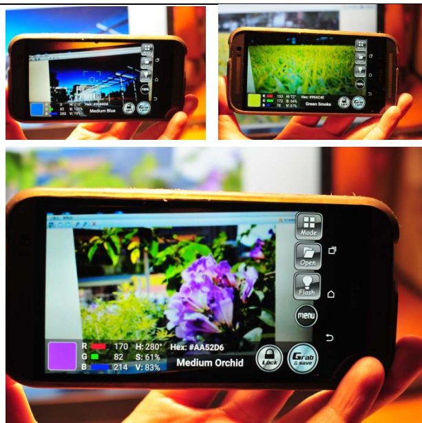
▲老師說明什麼是斑斕色彩。