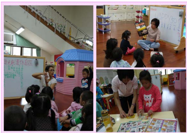
老師教導孩子利用回收物品製作裝飾品