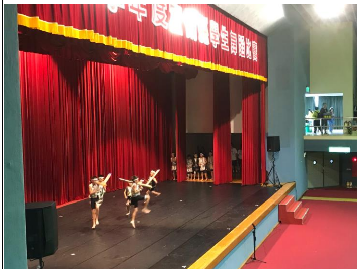
結合在地取材參與舞蹈比賽