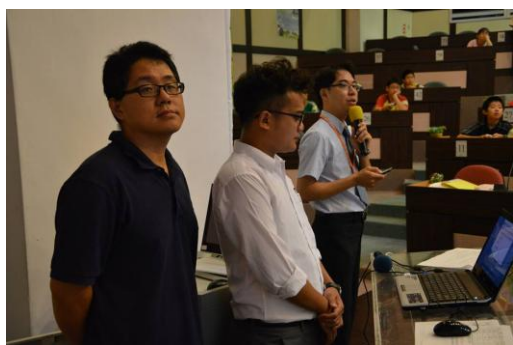
國小場次一系統操作人員及司儀