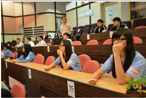
高中職組參賽情況