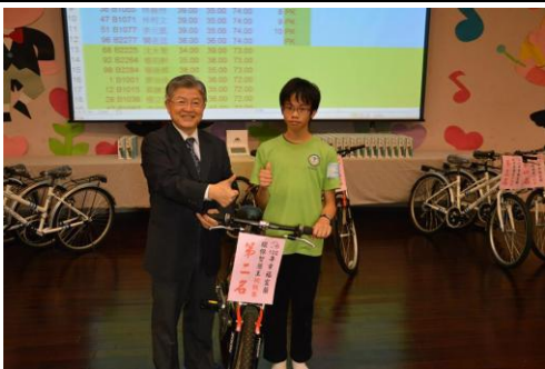
國中組教育處吳處長為第二名頒獎