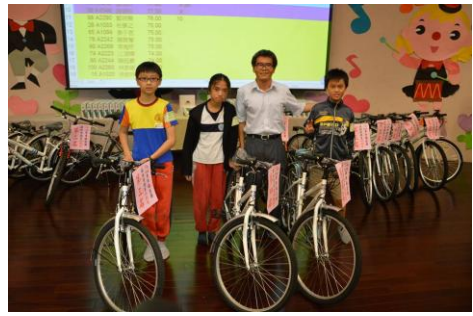
國小組第 3~4 名頒獎