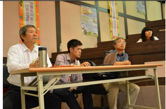
國中組評審及出題者