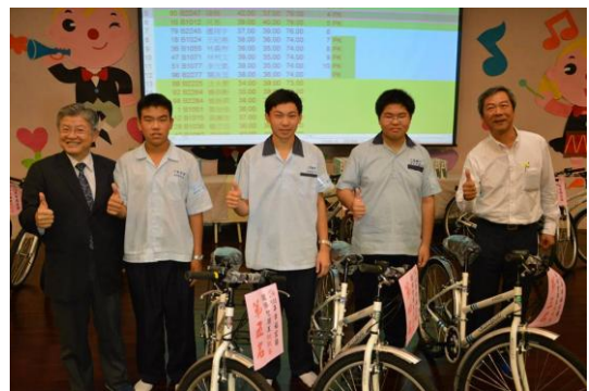
國中組前五名頒獎