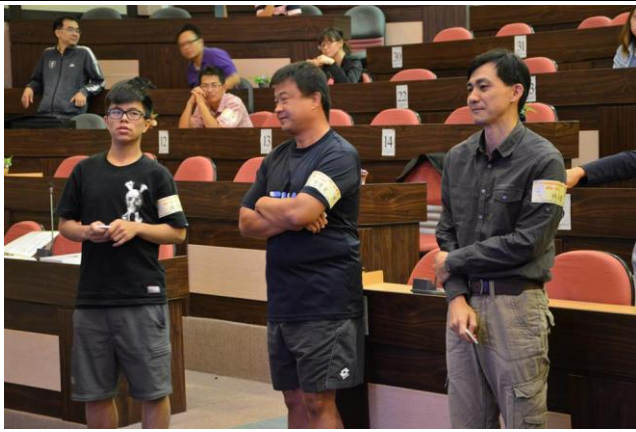
社會組 PK 賽