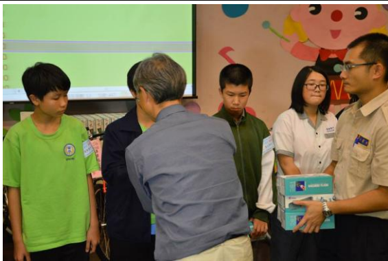
國中組頒獎—宜蘭大學李元陞教授