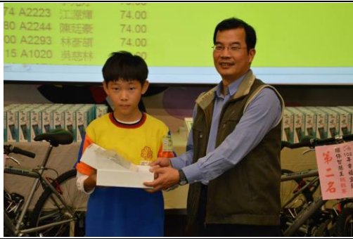
國小組第一名頒獎