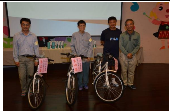
社會組前五名頒獎