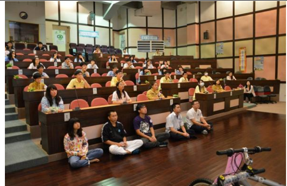
高中職組參賽情況