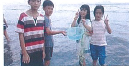
【六年級-台中科博館、飛牛牧場】