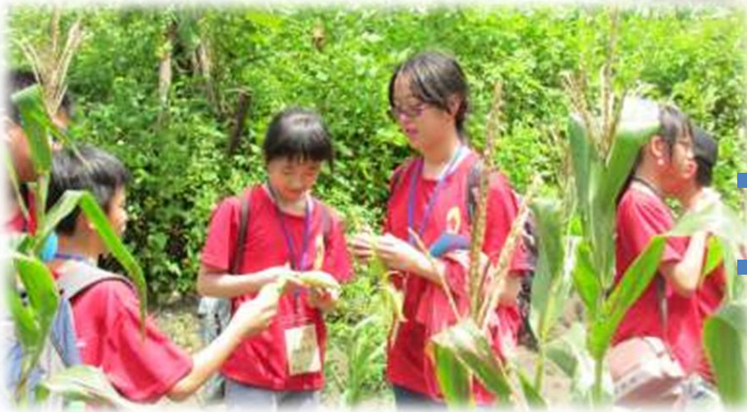
中山國小同學及校長現場生吃水果玉米