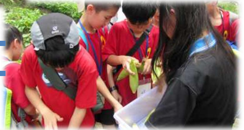
與中山國小同學分享水果玉米