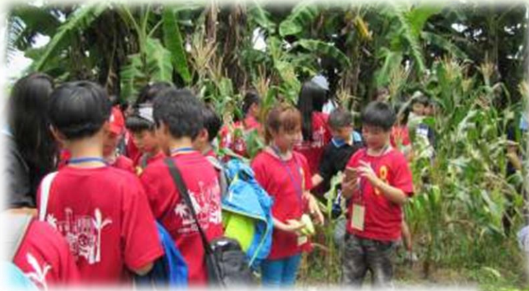
教導台北市中山國小同學一起體驗食農教育樂趣