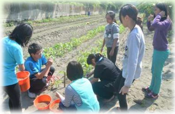
介紹沙地種植的作物及特性,