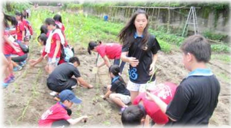
與中山國小同學一起種植水果玉米幼苗