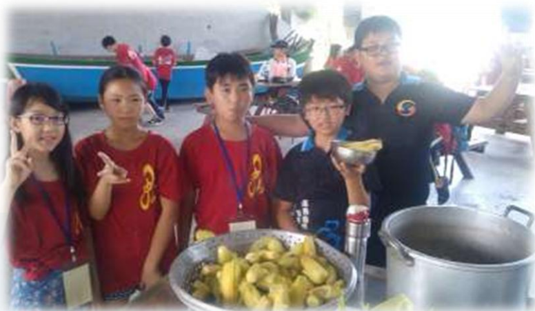
與中山國小同學一起分享豐收的成果