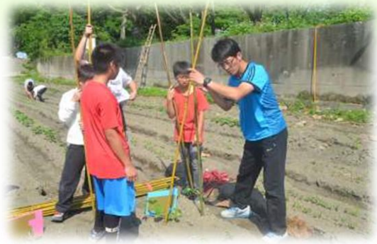
孩子們為植物~小黃瓜搭設棚架