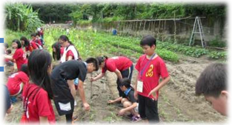
與中山國小同學一起種植水果玉米幼苗