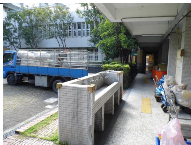
環保小天使協助清運物品回收圖4