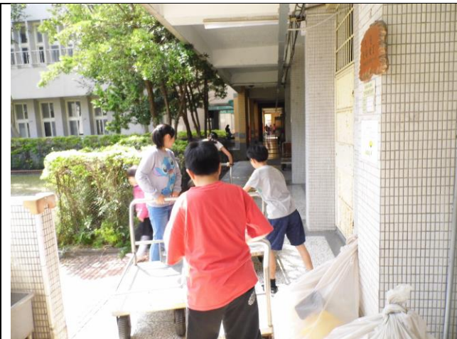
環保小天使協助清運物品回收圖1