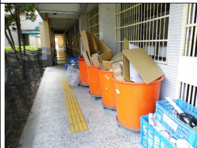
環保小天使協助清運物品回收圖3