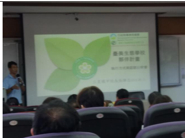
參加臺美生態說明研討會圖1