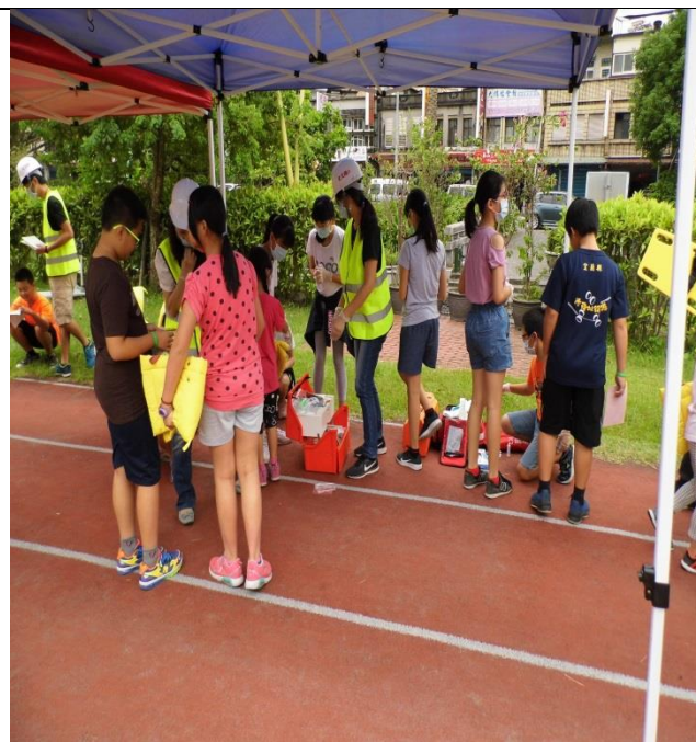
文字說明:傷患持續緊急救助