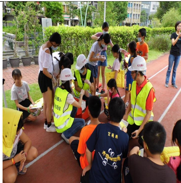
文字說明:傷患緊急救助