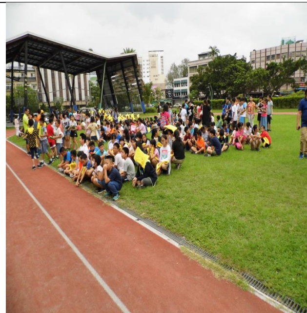
文字說明:學生避難區集合