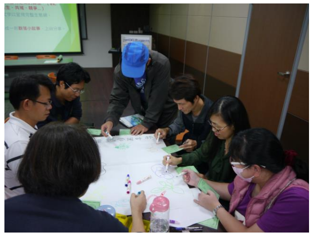
分組活動(認識不同物種間的關聯)