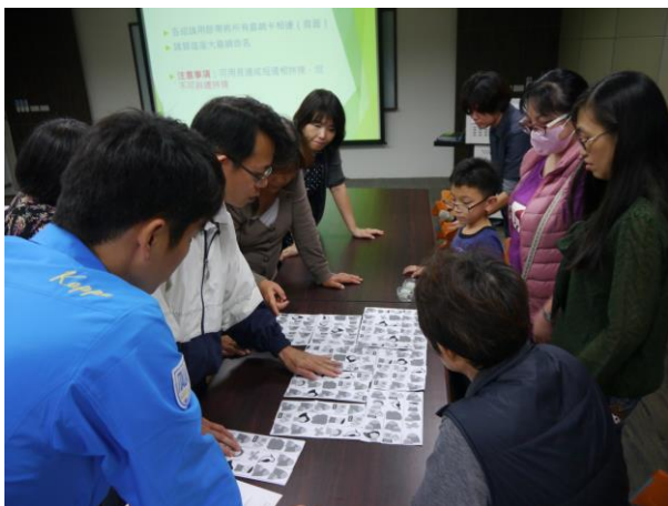
小組活動紀錄(新方舟藍圖)