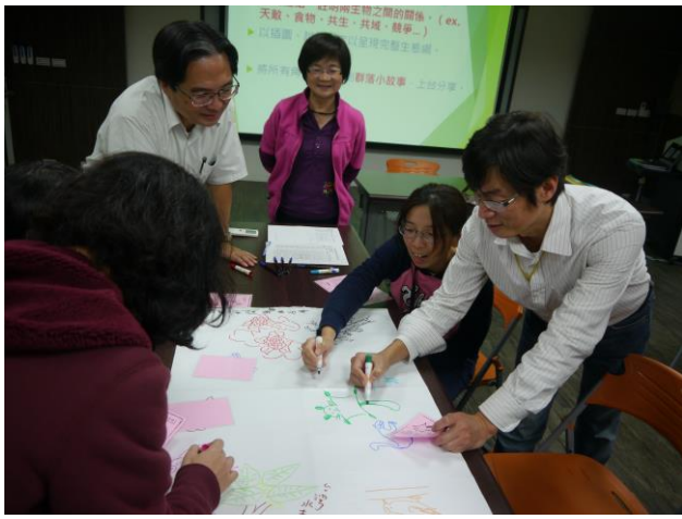
分組活動(認識不同物種間的關聯)