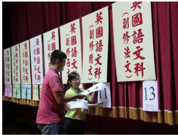
五專優先免試入學，明年試辦電腦填志願，一改傳統的撕榜方式。圖為文藻外語大學五專撕榜畫面。

2017-07-31 23:36 聯合報 記者馮靖慧／台北報導 讚 3 分享 傳送