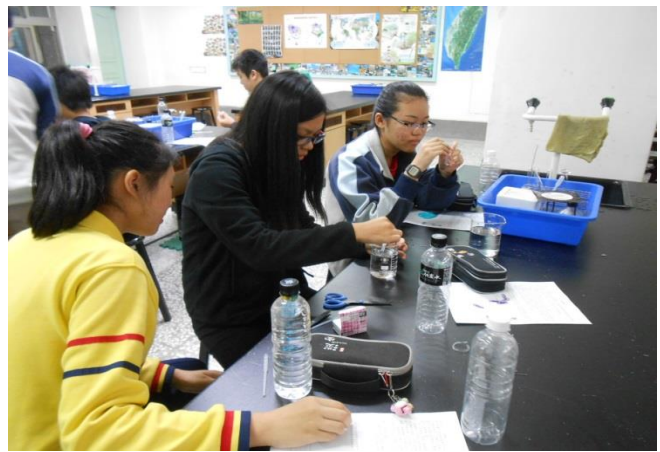
準備開始製作科學小玩具