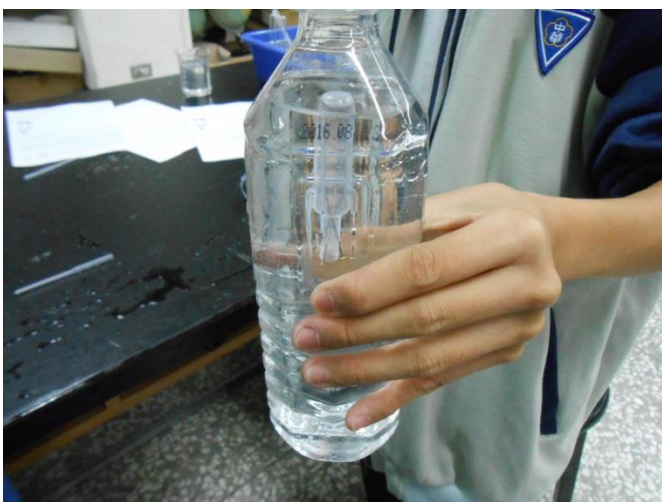
測試成品，大功告成~~YA