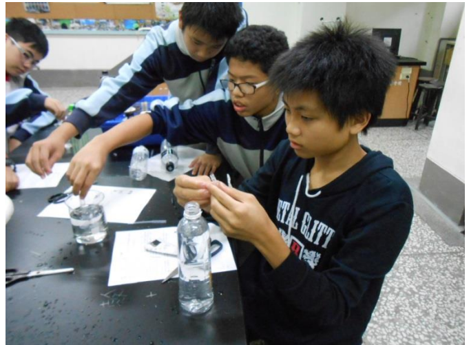
將小滴管插入大頭針