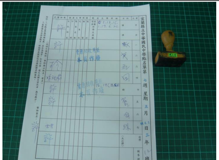
單面紙回收再使用-3