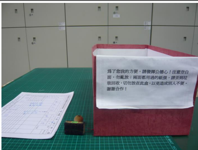
單面紙回收再使用-2